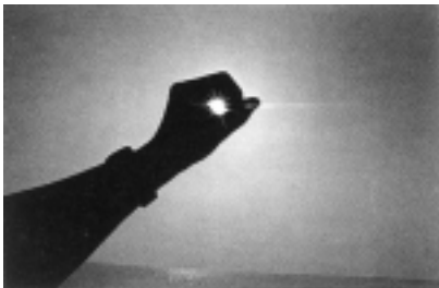
シリーズ「風景の光景」より 1970-80

つています。植田の被写体となる風景は、なにげない見慣れた景色ばかりですが、植田によって切り取られるそのイメージは植田独特の世界を描き出しています。つまり「吹き抜ける風」とは、様々な表情をみせる身近な風景が、写真家にシャッターを切らせる動機づけを意味するのでしょうか。人を被写体とした作品同様、風景写真も、ひとつひとつの出会いを大切にしながら植田にとっての一期一会の記録といえるのでしよう。