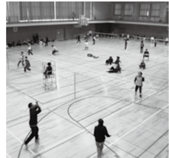
優勝をめざし奮闘する参加者たち

町民の健康づくりや体力づくり、親睦を目的に開催される、伯耆町バドミントン大会が、4月24日、町民岸本体育館で開催されました。 大会には、伯耆町内から19チーム、約150人が参加し、さわやかな汗を流しました。参加者の中には、シャトルが怖くよけようとする人や、足がもつれて転びそうになる人、軽快なジャンピングスマッシュを打つ人など様々でした。 大会の結果は、次のとおりです。