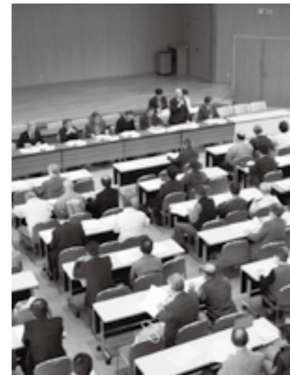
区長協議会の様子