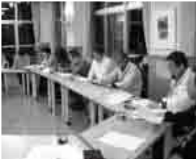
ボランティア連絡会

日光小学校では、学校支援ボランティア連絡会を6月1日に開催し、今年度の支援活動内容や注意事項などについて情報共有を図りました。連絡会の中で『喜んで子ども達の活動に協力をしていきたい』『定期的に子ども達と交流を図りながら作業をしては』というご意見をいただき、6月6日に、「第1回朝の環境整備活動」を実施しました。これは、児童の登校時間に合わせた校舎周辺の除草作業で、これから毎月第1月曜日を作業日として11月まで続ける予定です。