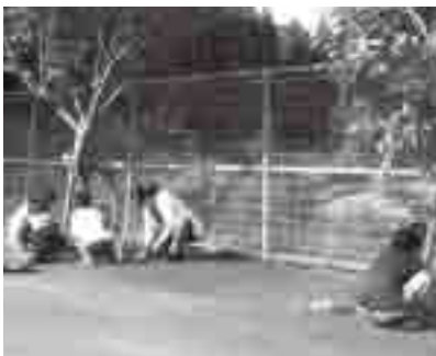
朝の環境整備活動

今後、地域の宝としての子どもたちの成長を楽しみに、保護者や公民館と連携をとりながら活動の充実を図っていききたいと考えています。