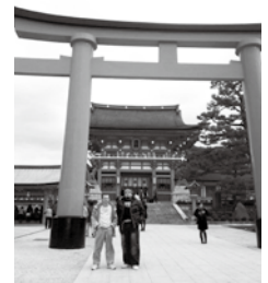
伏見稲荷大社にて