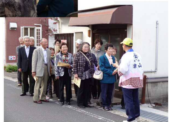
城東町並保存地区