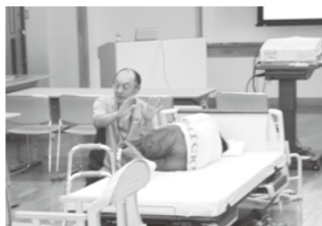
寝返りについて実技指導

この家族介護教室は、年2回、毎回違うテーマで開催しています。今年度も、もう1回開催します。防災無線、文字放送などでお知らせしますので、たくさんのご参加をお待ちしています。