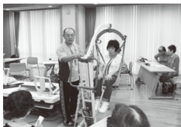
リフト移乗の体験

【問い合わせ先】 伯耆地域包括支援センター(健康対策課生活相談室内) ☎68-4632