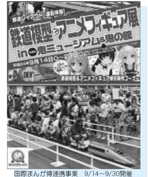
国際まんが博連携事業 9/14~9/30開催