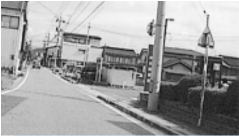
町道は年次的な改良を！

勝部 デマンドバスなどの通行を確保するためにも、町道の改良整備を検討すべきである。 町長 道路の「拡幅」や「線形改良」などは、検