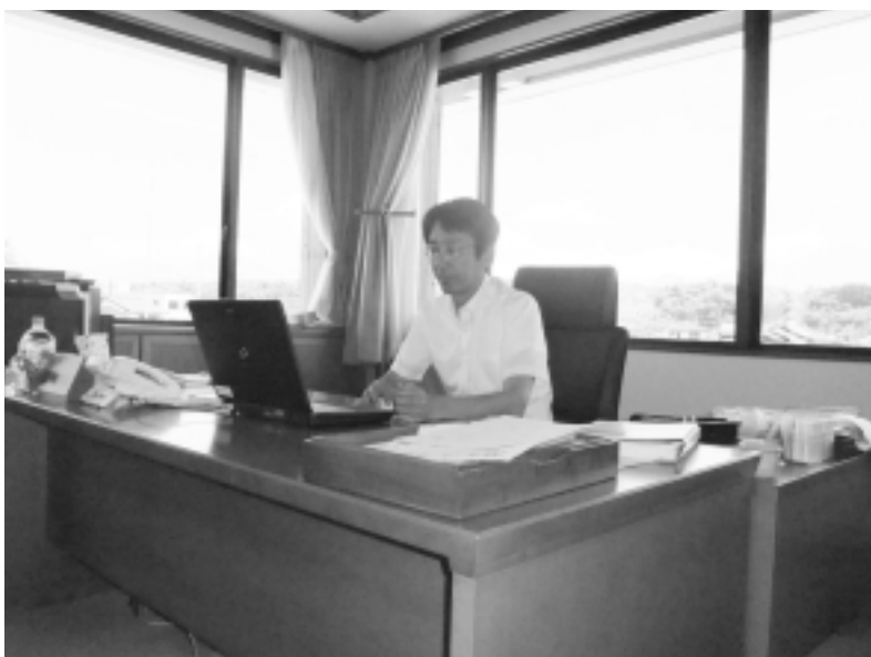
執務中の森安町長

町長 広域企業誘致は三年前から西部圏域の市町村長が整備を共有して取り組みを始めた。