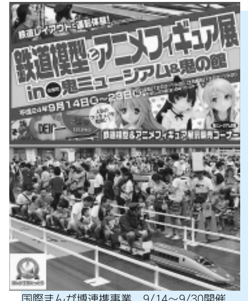
国際まんが博連携事業 9/14~9/30開催