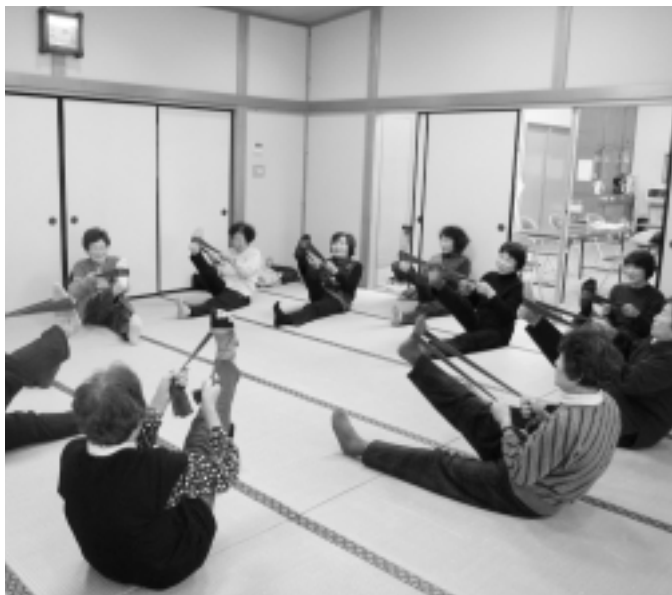
ポイント制度開始（まめまめクラブ）

枚のポイントカードを発行した。関心の高さがうかがえる、十月頃まで皆様の意見を聞かせていただき、年内には、ポイントの有効期限など見直しの方向で検討したい。