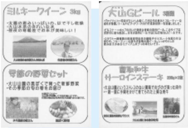
「ふるさと納税」新たなお礼の品を検討中