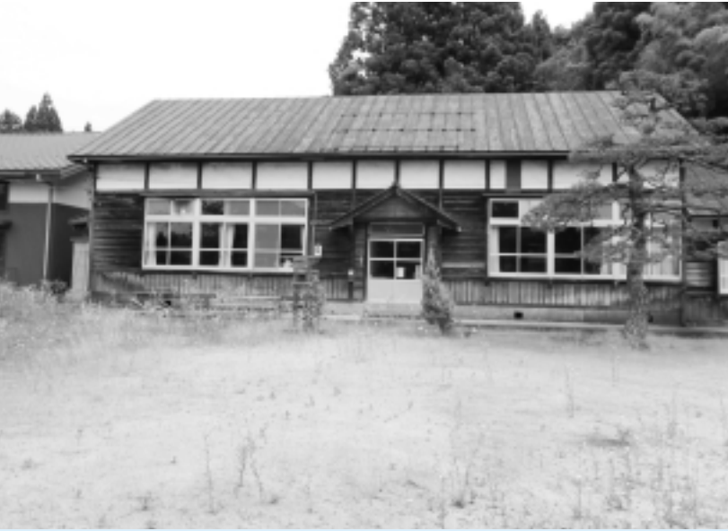
休校中の添谷分校舎