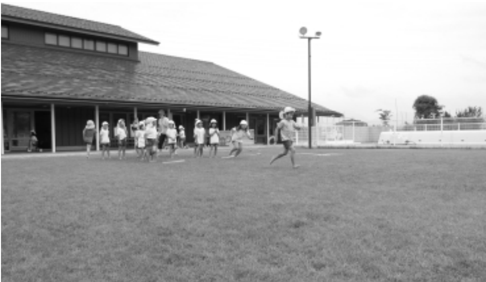
整備された芝生（こしき保育所）

教育長 芝生化の良さは認識をしているので、耐震化・大規模改修が終わりにしだいに検討したい。