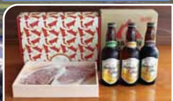
鳥取和牛サーロインステーキ200g×2枚と 大山Gビール330ml×3種類