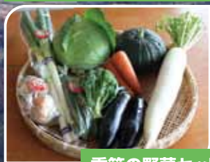
季節の野菜セット