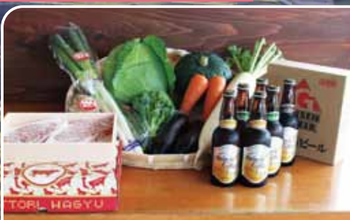
鳥取和牛サーロインステーキ200g×4枚と 大山Gビール330ml×3種類×2本と 季節の野菜セット