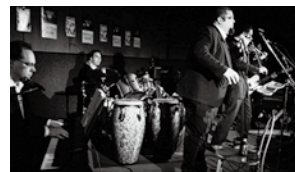
ワールド・ポップ・ミュージック!