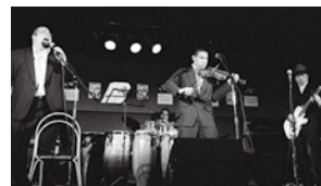
エネルギーギッシュなステージ