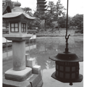
社殿から塔を望む