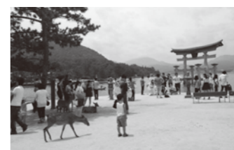
鳥居の近くは人と鹿でいっぱい!