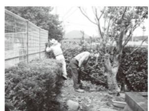
樹木の剪定作業「整った環境で豊かな心が育つ!」

今年度は、春先に、荒れていた学校農園の整備をしていただきました。おかげで、2年生と特別支援学級の生徒が夏野菜を育てることができました。夏休み前にはジャガイモ、キュウリ、オクラなどを収穫し、現在はトウモロコシ、枝豆などが実っています。作物は記念の写真を撮り、大切に収穫しました。