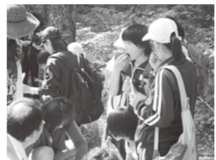
ロングウォークでの安全指導や給水など「疲れをいやせた」「また歩ける!」