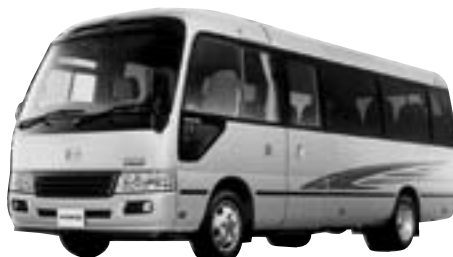
マイクロバス (29人乗)