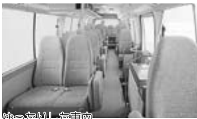
ゆったりした車内