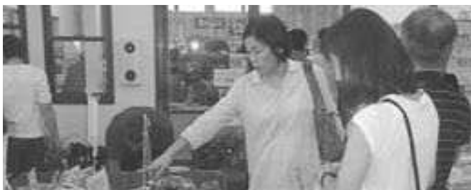
安全運転で買物（大山ガーデンプレイス）

教育長 法規制も含めて現地での有効性があるかどうか、検討の上、関係部局に整備要望も考えていきたい。