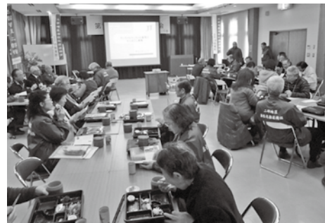
平成25年度事例発表・交流会の様子

【問い合わせ・応募先】 事務局 企画課 町づくり推進室 ☎68-3113 FAX68-3866 Eメール machidukuri@houki-town.jp