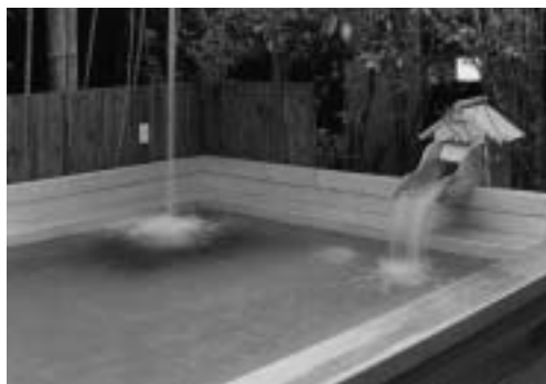
おすすめの露天風呂

伯耆町に住んでいるけど町内にある施設について詳しく知らない、行ってみたいけど場所がわからない。このコーナーは、そんな悩みをお持ちの方に町内の施設を紹介しています！ 第二回目の今回は、循環バスが殿河内（いしかわ前）で停車するようになり、さらに便利がよくなった「岸本温泉 ゆうあいパル」をご紹介します！