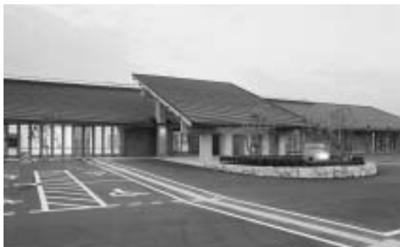
保健福祉センター外観

温泉は、地下一、一五〇mから汲み上げるアルカリ性単純泉の湯で、神経痛、冷え性、疲労回復、リフレクシユ効果なども期待できる、肌触りが柔らかく入り心地の良い温泉です。