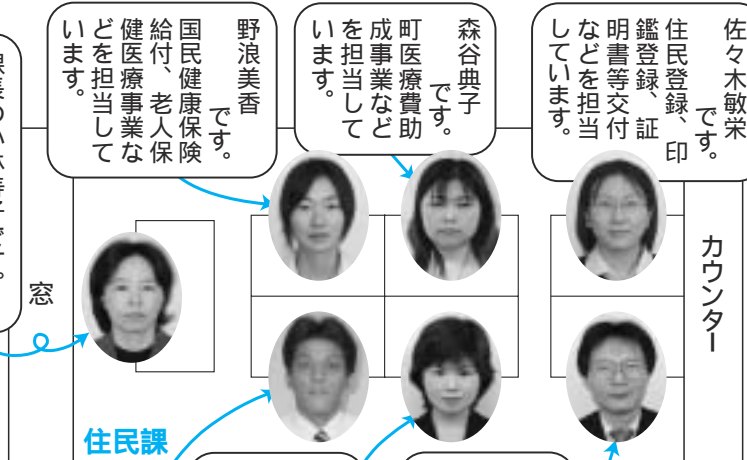
伯耆町役場(岸本庁舎)配置図