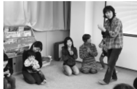
親子で一緒に手遊びをしました

三月二十九日(水)、溝口公民館三階に溝口図書館キッズルーム「お話の部屋」が開設されました。 このお話の部屋では、幼児や小学生を対象に、絵本の読み聞かせや昔話、わらべ歌などが今後も行なわれる予定です。今後の詳しい予定などは図書館にお問合わせください。 みなさんのご利用をお待ちしています。