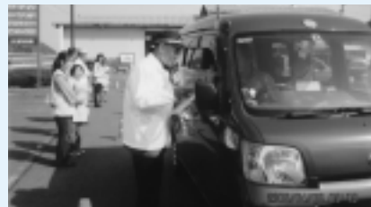
交通安全をよびかけました