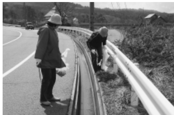
少人数のグループにわかれてゴミを拾います

四月十六日(日)、春の大山一斉清掃が榎水高原周辺で行なわれました。町内・町外問わずたくさんの方々が参加されました。ゴミを拾ってみると、空き缶やペットボトルなどたくさん落ちており、普段から自分が出したゴミは持ち帰るなどの心がけを忘れないようにしたいと思わずにはいられません。半日清掃に取り組まれたみなさんのおかげで、大山がきれいになりました。ありがとうございました。