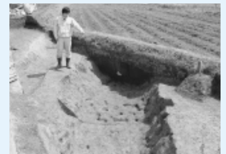
長者屋敷跡で見つかった溝状遺構

三月三〇日(木)、長者屋敷遺跡(西伯郡伯耆町岩屋谷)に関する記者発表が開催されました。 この調査によって、会見郡衙施設南側の区画が明らかになり、古代会見郡衙の範囲や内容を解明していく上で、貴重な資料を得ることができました。