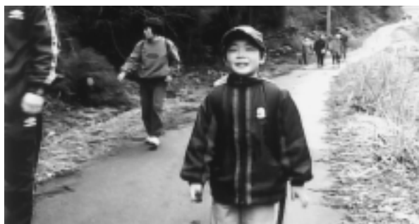
元気に歩きました

四月二日(日)、二部から日野方面に向けて、ウォーキングが開催されました。 このウォーキングは、二部地区活性化推進機構の健康スポーツ部会で計画されたものです。 二部地区活性化推進機構とは、二部地区を活性化するために二部地区在住者を会員として構成された組織で、地域のコミュニティ活動を六部会に分かれて計画し、実行しているものです。 年間とおして、様々な取組みが行われますので、みなさん、ぜひご参加ください。