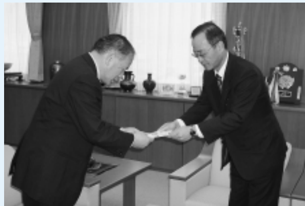
ご寄附ありがとうございます

三月二十九日(水)、エネルギー文化・スポーツ財団から、オールジャパンジュニアトライアスロンin岸本大会に助成金をいただきました。 これは、文化及びスポーツの諸活動に対するの振興支援として助成されるもので、オールジャパンジュニアトライアスロンin岸本大会の趣旨に賛同しての助成です。 この助成金は、今年八月に開催される大会に使われます。参加者のみなさんの思い出として心に残るような大会を実施したいと考えています。