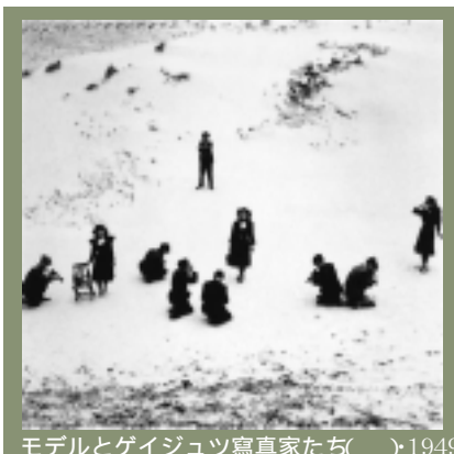
モデルとゲイジユツ写真家たち( )1949