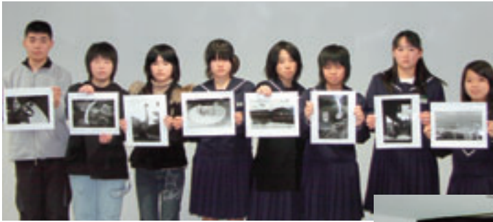
みんなが作った作品を披露