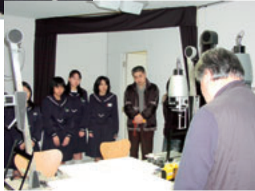
暗室の説明を聞く様子