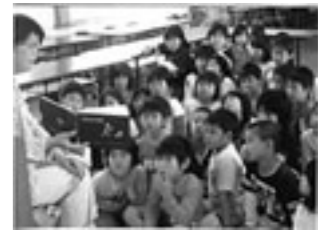
絵本の世界に入ってみんな真剣にきいていました。～岸本小学校おはなしのもりより～

岸本小・八郷小は月2回、ふたば保育所は月1回です。ぜひ、楽しみに待っていてください。