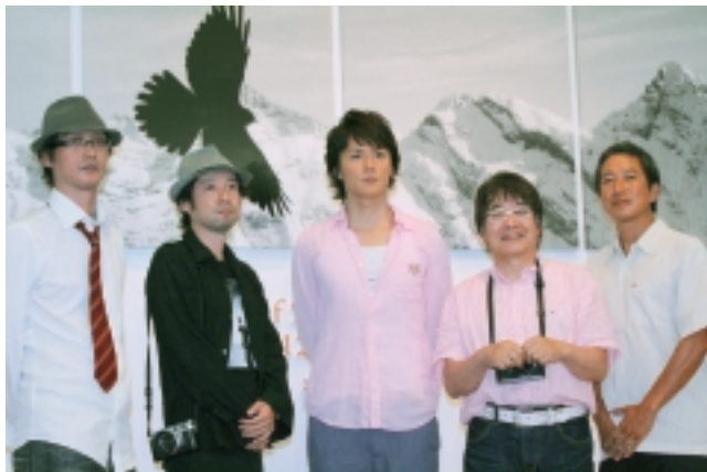
福山雅治・4人の写真家記者会見

植田正治写真美術館では、2006年に六本木ヒルズで開催された展覧会「PHOTO STAGE」の記憶の箱庭を、植田正治写真美術館バージョンとして7月28日から開催しています。