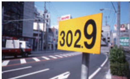
シリーズ〈印籠カメラ〉より1995-97年

初めてカメラを買ってもらった少年時代の頃から晩年まで、植田は、ほとんど毎日といってもいいほど周囲の風景を撮り続けていました。風景に何かしら心を動かされるその瞬間、すばやくカメラを向けてファ