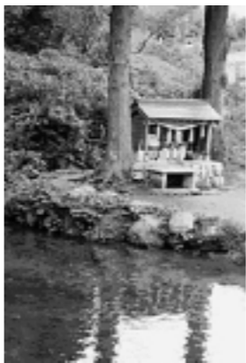
平成の名水「地蔵滝の泉」