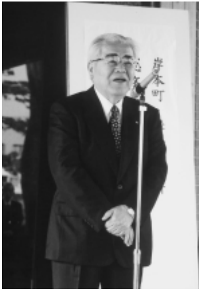
総務大臣告示を記念する式典にて

みなさんお元気ですか。相次ぐ台風の影響でさぞご心配だったと思います。被害に遭われた方々にお見舞い申し上げます。 ○十月二十三日、夕方、新潟県中越地震がおき、私たちが経験した鳥取県西部地震に比べ、その被害の大きさをテレビの画面で見るとき、罹災された方々にお見舞いの言葉もありません。西部の町村ではとりあえず一町村で毛布二百枚とビニールシート百枚、届けることを決め、自衛隊の協力を得て送りました。 一日も早い復旧を願わずにいられません。 ○今年の運動会は雨で流れてしまいました。当日の朝、私も心配で