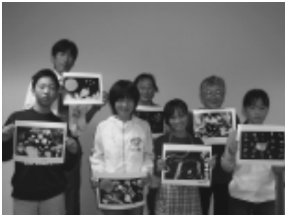
保護者の方も一緒に参加