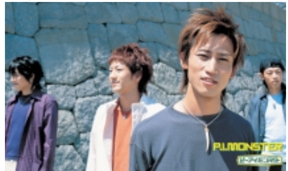
5枚目のシングル「ケセラセラ」TBS系愛の劇場「温泉へ行こう4」主題歌などリリース

開演日時：2004 11/20 (土) 開場 14:00 開演 15:00 場 所：岸本中学校体育館 入 場：招待入場券を配布(無料)