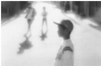
シリーズ 白い風 より