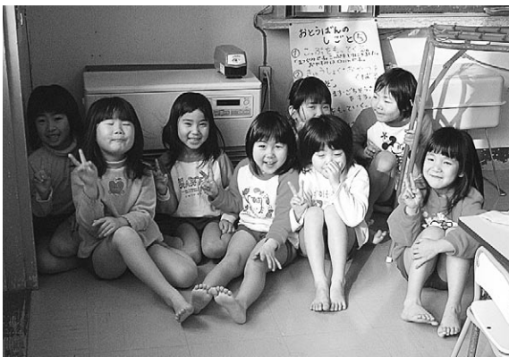
こしき保育園園児たち

町長 現在は保育所内の施設で一応対応出来る状況であるが、今後の乳児の入所状況等を踏まえ対応したい。