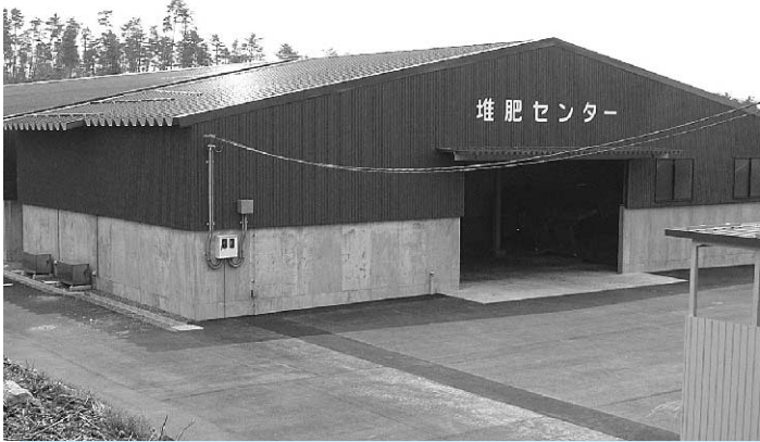
堆肥センター（真野地内）

家畜排泄物の適正な処理による環境保全と、耕畜連携による地力の増進を図る為、昨年末より稼働している。