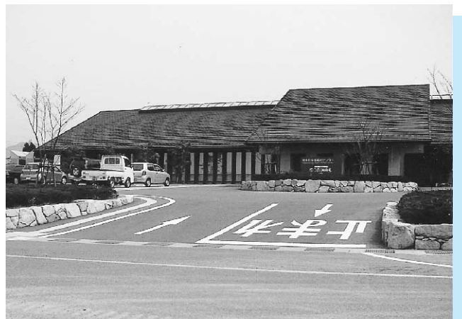
岸本保健福祉センター