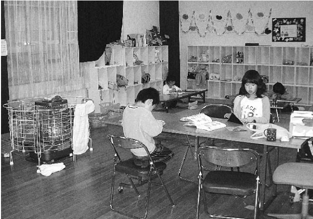
学童保育 (溝口青年の家)

A 町長 対象児童枠拡充、岸本放課後児童クラブ長期休暇、冬休み、春休みの開設についてもニーズにより検討する。