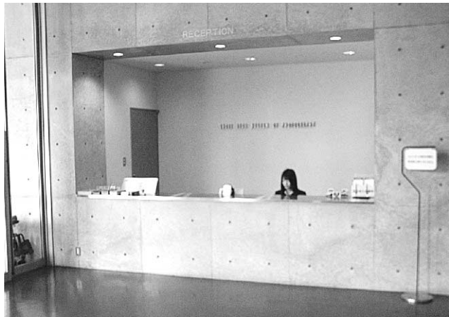
町立写真美術館の受付（須村地内）

Q 写真美術館など公的法人の経営改善は、議会も再三求めてきたが、改善の兆しが見えない。理事長、社長に民間の優秀な人材を登用して、経営を任せてみてはどうか。