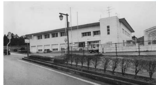
改修されるB&G体育館

障害者差別解消法の自治体対応は 幅田 4月実施の障害者差別解消法に対応する自治体の取り組みは。 町長 ガイドラインを作成・公表して啓発等、解消のための役割を果たす。