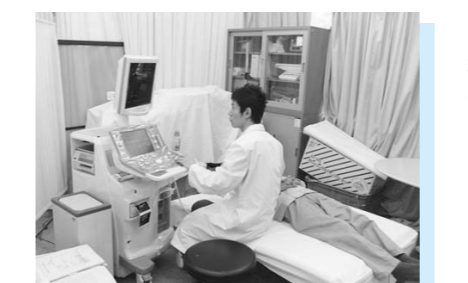
頸部血管超音波検査

法改正があったので、項目増や内容変更の確認を行い実施したい。 学校職員は、今後、県教委で実施すること。 永井 鳥取県では、65歳以上の高齢者16.7万人のうち認知症の方2.5万人、軽度認知障害の方2.2万人といわれる。 高齢化社会進展で、地域で生活される方も多く、正しい理解と見守る応援者となる認知症サポーターの養成状況は。