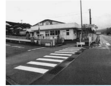
床暖房が改修される二部保育所

3月定例会の3月3日の初日、森安町長から平成28年度一般会計予算について次のとおり提案理由の説明があった。その要旨は、次のとおり。なお、記載された金額は、予算書等から引用し、表示。