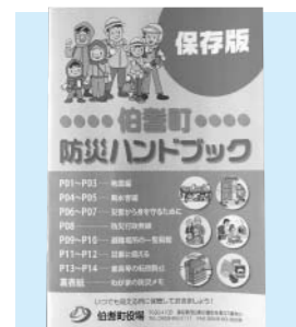
伯耆町防災ハンドブック