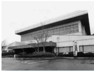
改修の詳細設計へ(溝口町民体育館)