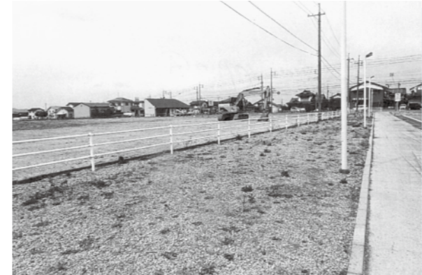
ダイレックス伯耆店進出予定地(大殿・R181沿い)