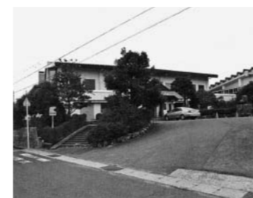
改修される町民岸本体育館