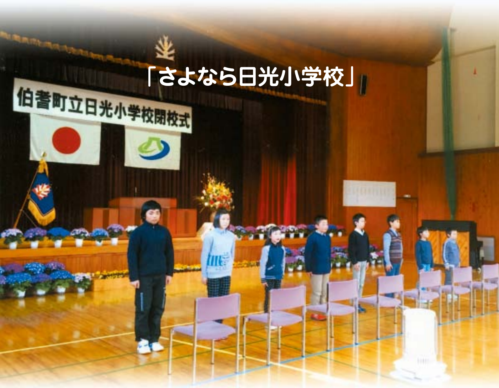
日光小学校の閉校式 (H28.3.24)