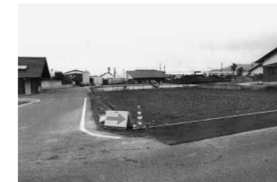
小規模保育施設の新設予定地(大原・岸本保険福祉センター隣接地)