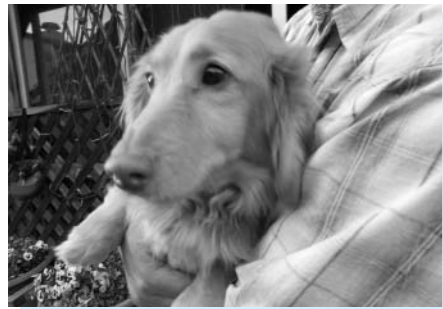
ペットは家族の一員

乾 ペット同伴避難については、受け入れ判断の規定は、総務課長 飼い主による責任ある管理をお願いしたい。平時においても、災害等を想定の上でケージやキャリーバッグに慣らしておくこと。むやみに人に吠えない、決められた場所での排泄などの「しつけ」。予防接種。寄生虫駆除などの健康管理ができていないこと。また、被災者の中で動物の苦手な人や、動物に対してアレルギーを持つ人については特別な配慮が必要。この場合は、ペット同伴避難は難しい。同伴避難ができない場合の措置は、収容可能な施設を調べてお知らせすることになる。