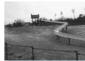
更新される遊具(総合スポーツ公園・大原)