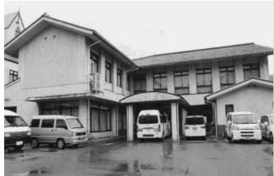
長寿化と介護サービスなどの機能アップへの詳細設計へ(溝口保健福祉センター)