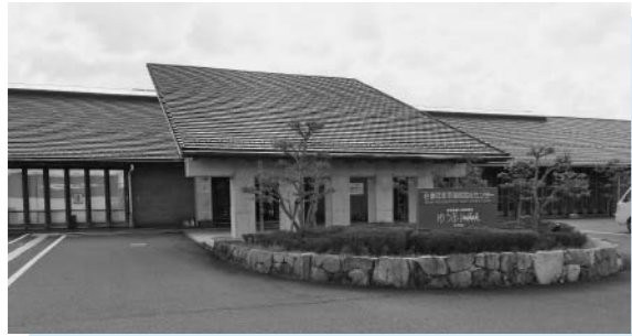
岸本健康福祉センター

子どもの医療費 完全無料に 幅田 窓口・入院・食事等、完全無料化すること、そのために、制度化を国に求めよ。 町長 ナショナルミニマム・国で議論をすべきではないかと思う。