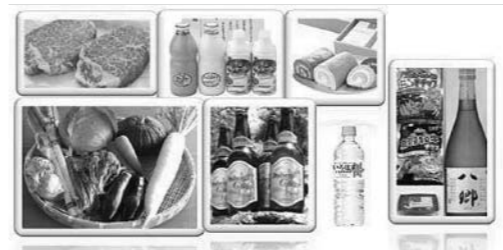
ふるさと納税お返し品

乾 裕議員 野良猫等去勢・避妊手術費助成金 乾 具体的な制度設計は、 地域整備課長 繁殖を予防し、殺処分を極力回避するのが目的。集落等が主体的に、町所有の捕獲器（1台）を使い野良猫を捕獲し、避妊・去勢手術を受けさせた場合、町が費用の一部を助成する。術後、猫の取り扱いには、原則申請者の判断にゆだねる。 バス車庫整備事業 乾 現在屋外駐車場の町所有バス3台の車庫を、溝口武道館の駐車場に建設するののか。