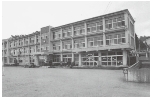
主権者教育は、小学校・中学校から早期に（耐震改修が行われる二部小学校）

勝部 本町の小・中学校においての選挙に関する「主権者教育」は、 教育長 社会に参加し、自ら考え、自ら判断する者を育てることとし、選挙は、民主主義の基盤をなすものである。 勝部 我が国の政治、地方の政治、世界の国々の仕組みなどの教育は、 教育次長 小学校は、6年生から、中学校は3年生