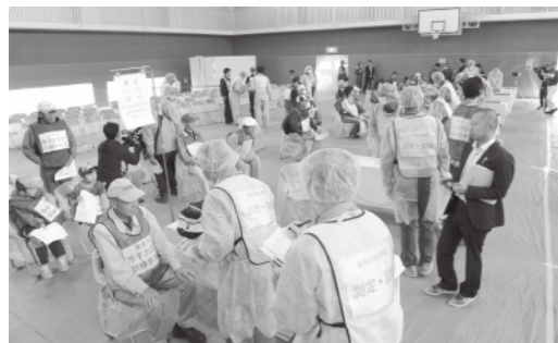
スクリーニング検査訓練

けて岸本中学校へ到る部分の改良の考えは。 町長 この路線は、昨年10月14日の交通量調査でも伯耆橋付近で12時間で約7千900台を記録し、大きな交通量である。内部的にも検討し、技術的、用地的にも可能ならば国や県とも協議をさせて頂きたい。 勝部 B&G海洋センターの原発事故に伴う汚染被ばく検査地点の設定について県との協議状況等を伺う。 町長 この問題は、印象としてバタバタとしている。 総務課長 B&Gは、車両除染可能駐車場や建物があることなどからH24年に県より選定されている。 勝部 これの県との書面での協定はあるのか。 総務課長 正規な書面協