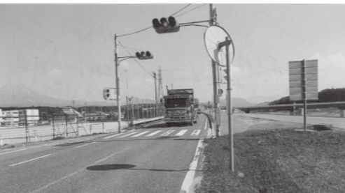
岸本中学校前の東側への右折レーンの新設が望まれる県道淀江岸本線（岸中入口）