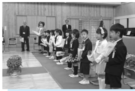
二部小学校の入学式の様子

町長 これまで町長は、地方創生に関する発言で「基礎自治体として基本的なことをやれば、おのずと結果は出る」とか、「近隣の市町村と人の奪い合いはいかがなものか」という旨の地方創生に消極的な発言をしてきた。その中、平成28年度予算では、地方創生関連の新規事業を含め、前年度比4億2千800万円増となった。国内外の政治情勢が激変する中、地方創生、PPP、一億総活躍社会など国主導の課題が、本町の現状課題とどのような整合性があるかなど、これまでの発言を考えると、非常に疑問や不安を覚える。本町の課題をはっきりさせるため