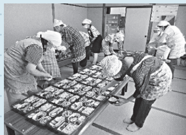
思いを込めてお弁当を作りました