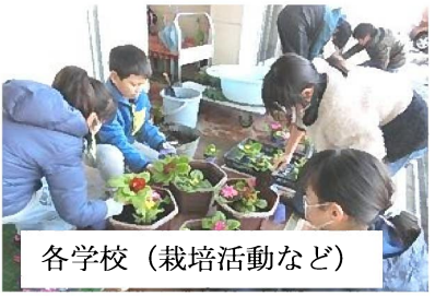
各学校 (栽培活動など)