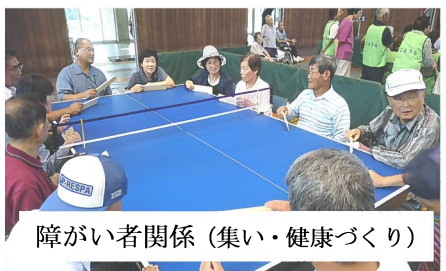
障がい者関係 (集い・健康づくり)

令和元年度におきましても、地域歳末たすけあい募金については、町内のお一人暮らし高齢者の方々等約 200 名に心温まるおせち料理お届けすることができました。ご協力本当にありがとうございました。