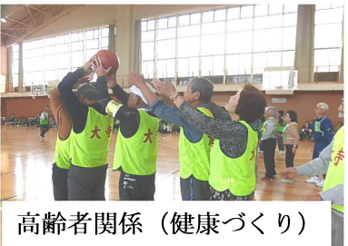
高齢者関係 (健康づくり)