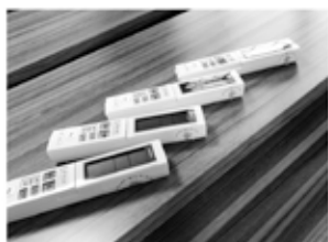
エアコン用リモコン

(一財)自治総合センターが宝くじの収入を財源に行っている「コミュニティ助成事業」を活用し、久古区がエアコン他コミュニティ活動備品を宝くじの助成金で整備しました。これにより、集落活動への参加者の増加やイベント等の活動の充実が期待されます。