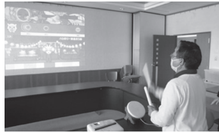
「太鼓の達人」に挑戦！

今回のふれあいサロンは、eスポーツ(イースポーツ)の体験会でした。eスポーツとは、エレクトロニック・スポーツの略称で、ゲーム機を用いて行う娯楽、競技、スポーツ全般を指します。年齢や性別に関係なく、一人でもグループでも楽しむことができます。