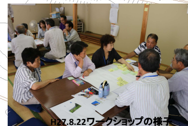
H27.8.22ワークショップの様子