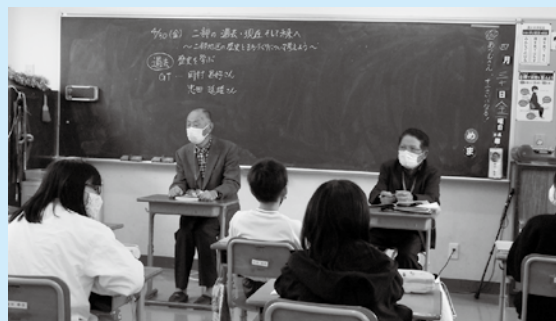
地域の方からお話を聞きました

多くの方がタタラ製鉄に関連する仕事に従事していましたが、海外から安価な鋼材が大量に輸入されるようになると、大正時代の末期には