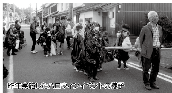
昨年実施したハロウィンイベントの様子