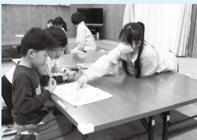
児童クラブで学習支援

伯耆町地域学校協働本部では、これまで、小中学生の学習支援や安全見守り、学校の環境整備などで、学校を支援する『てごネット』を組織し、地域の「てごシャワー」を、子どもたちにしっかり浴びせるように進めてきました。