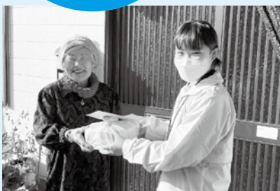
年末のおせち配付