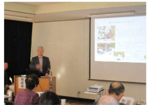
《全国大会の参加報告》

当日は、地域づくり全国研修交流会の参加報告をはじめ、日光区協議会の活動報告、溝口中学生から溝口を活性化するためのアイデア発表、地域おこし協力隊（江府町）の活動報告がありました。