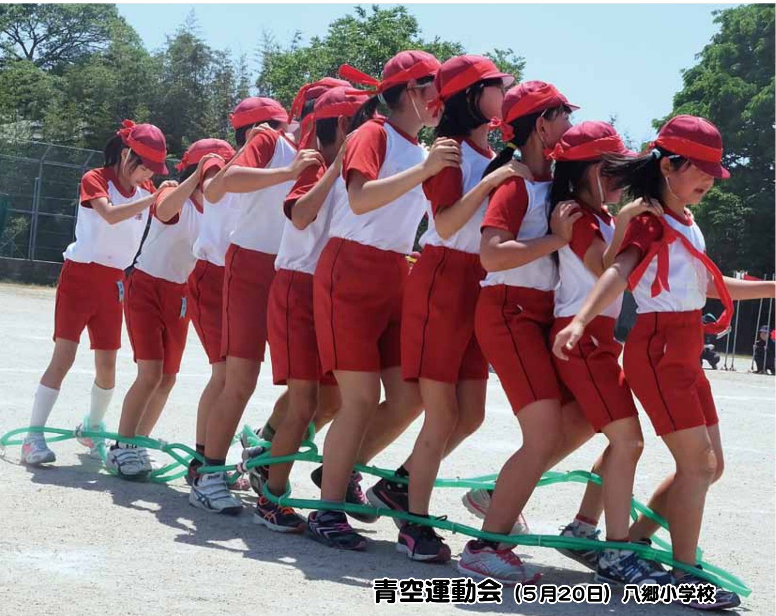
青空運動会 (5月20日) 八郷小学校