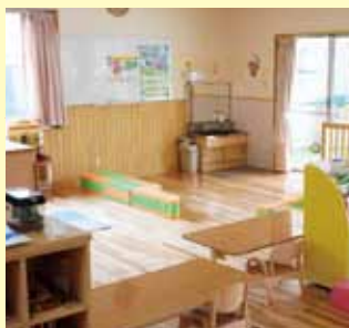
「お問い合わせ先」 小規模保育所

存在意義を痛感しています。これからも明るく、健やかな児童の育成に取り組んでまいります。また、事前連絡を頂ければ、気軽に施設見学も可能ですので、お問い合わせください。