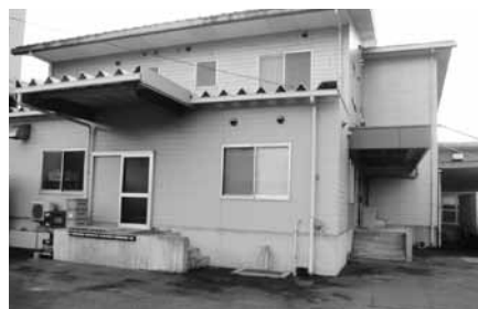
給食センターの改修