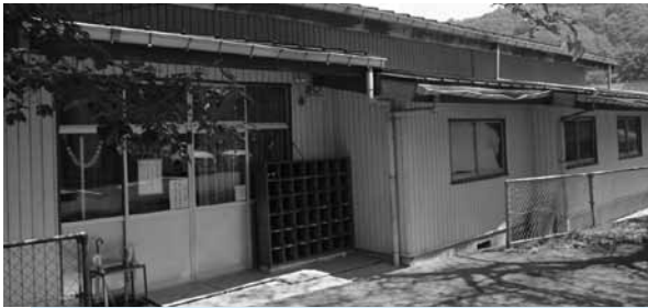
溝口放課後児童クラブ改築