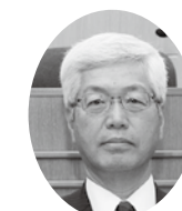
永井 欣也 議員