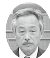
松原 研一 議員