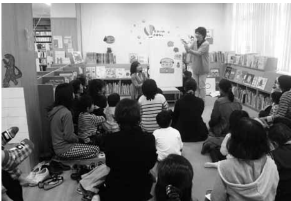
読書活動(岸本図書館)「おはなしのもりスペシャル」