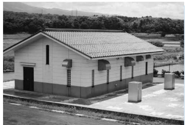
農業集落排水事業 遠藤地区処理施設