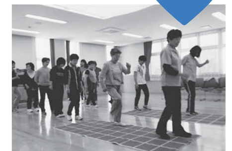
スクエアステップの様子