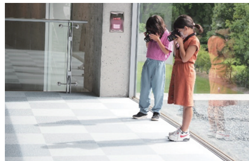
二部小写真クラブの児童が一眼レフカメラで撮影体験

6月下旬から7月下旬にかけて、今年度もフォトスクールを実施しました。キャノンマーケティングジャパン株式会社様から一眼レフカメラをお借りし、町内小中学校、岸本公民館親子写真教室、文化センター、伯耆みらいの8団体が参加されました。