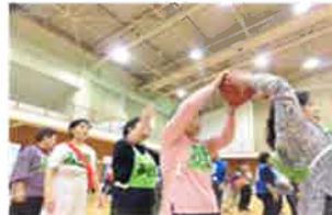
高齢者関係（健康づくり）