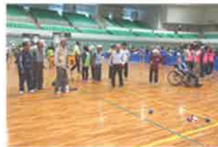
障がい者関係（集い・健康づくり）