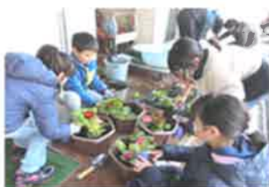
各学校（栽培活動など）