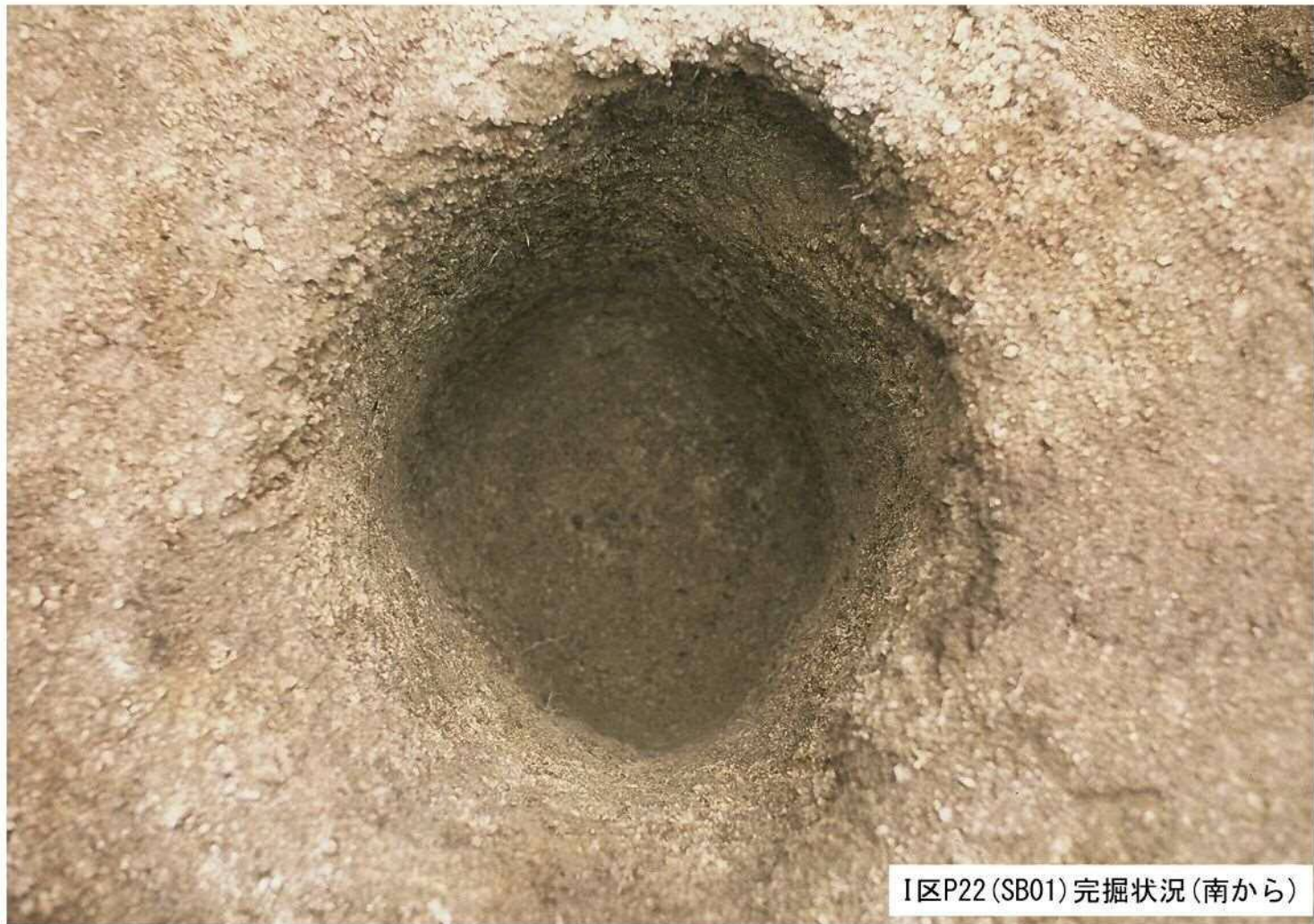
I区P22(SB01)完掘状況(南から)