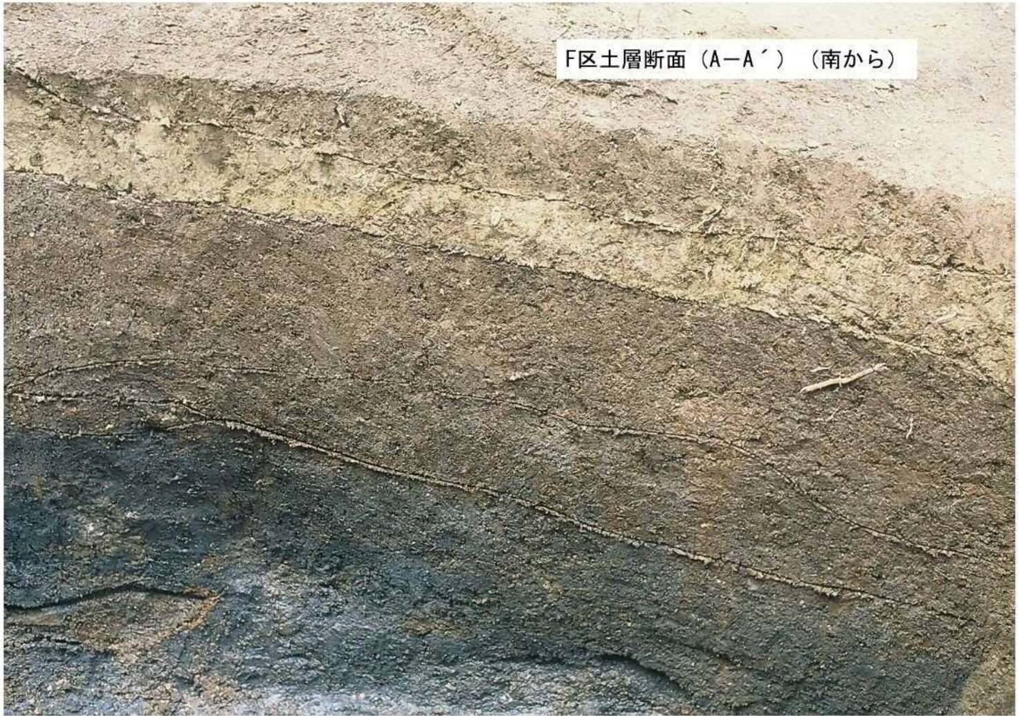
F区土層断面 (A-A') (南から)