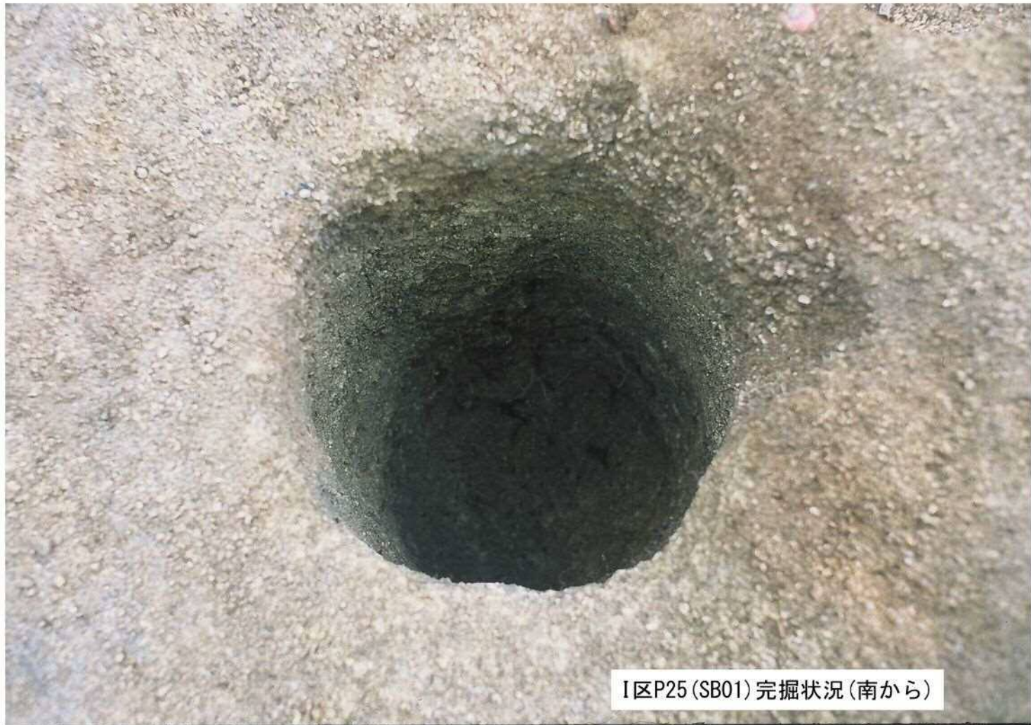
I区P25(SB01)完掘状況(南から)