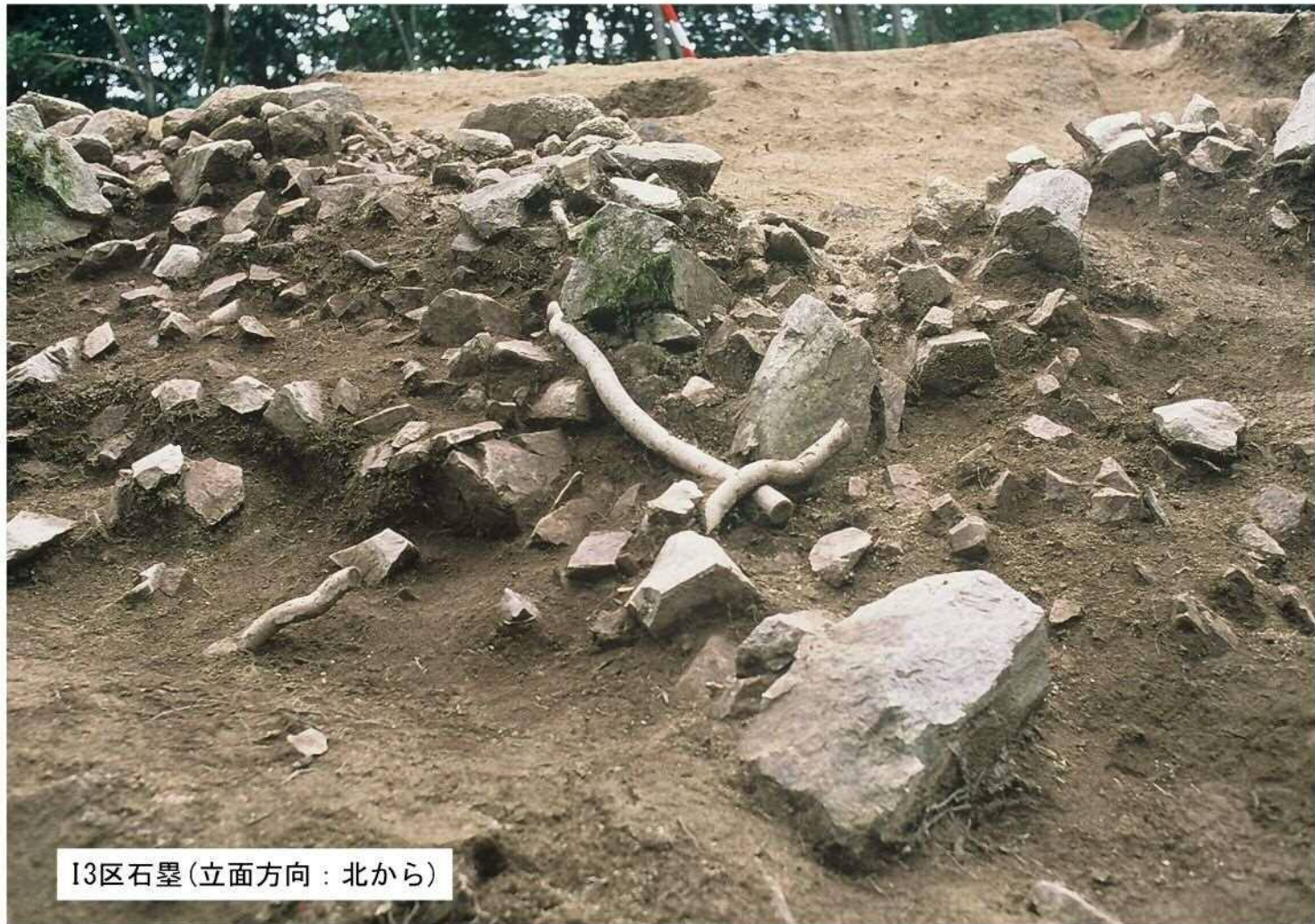
I3区石罫 (立面方向 : 北から)