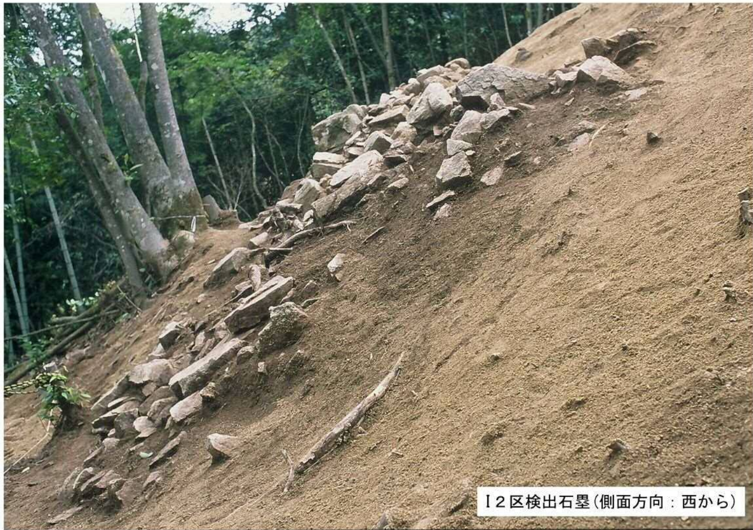
I 2区検出石罫(側面方向:西から)