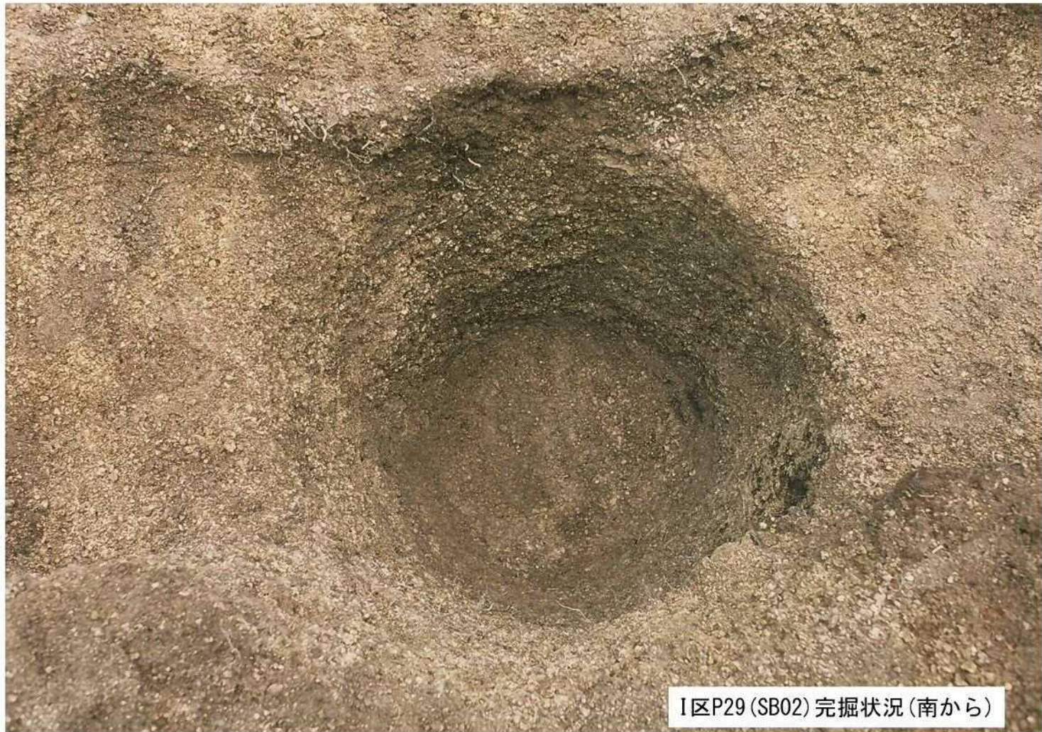
I区P29 (SB02) 完掘状況 (南から)