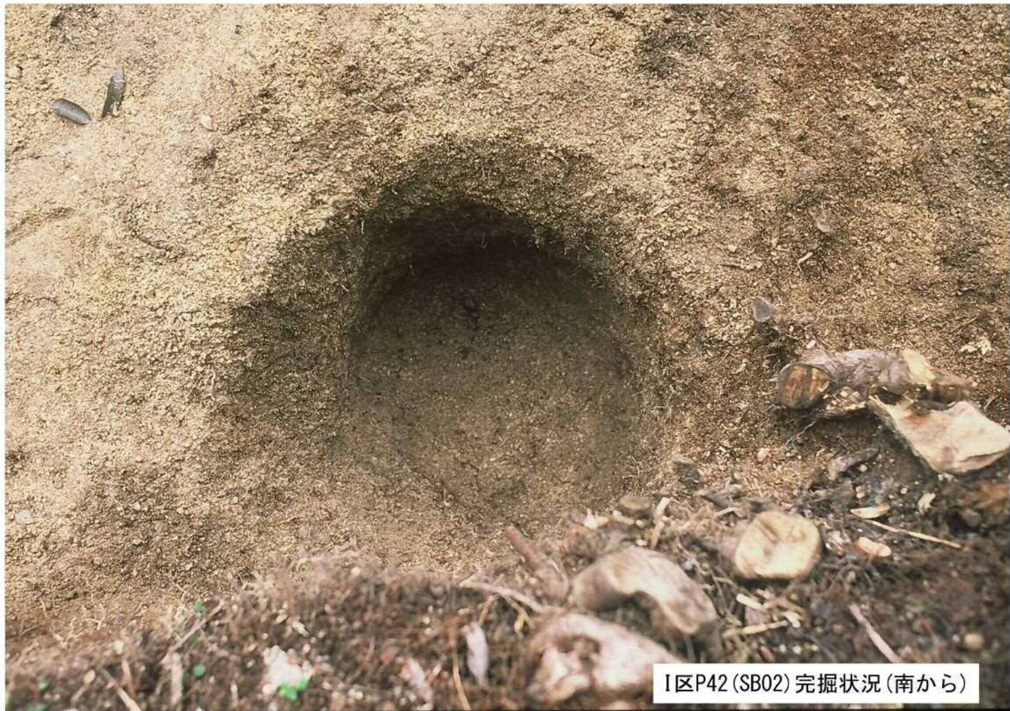
I区P42 (SB02) 完掘状況 (南から)