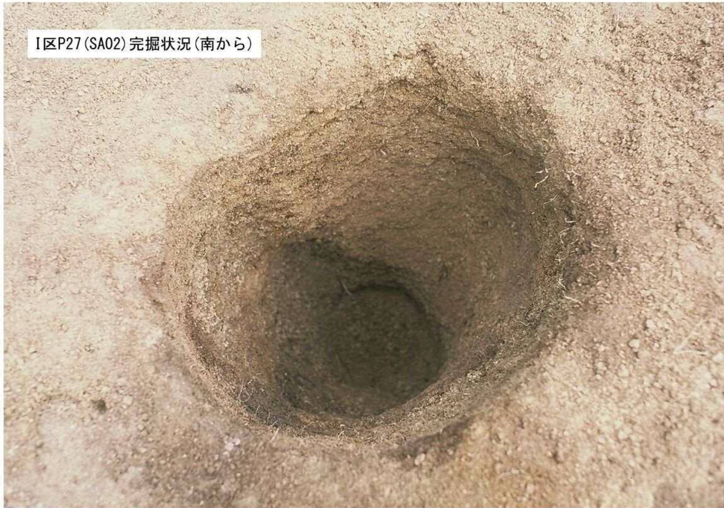
I区P27(SA02)完掘状況(南から)