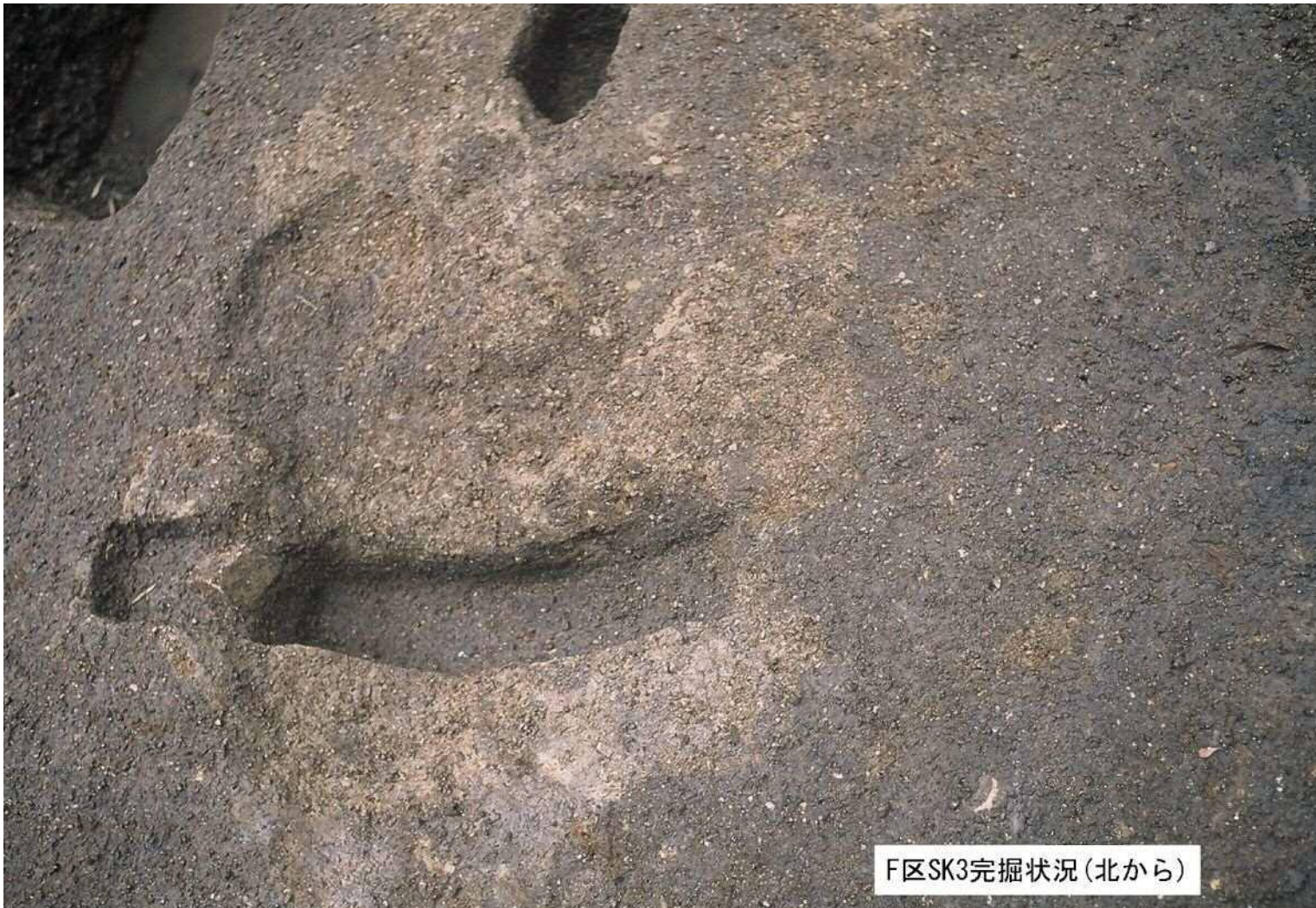
F区SK3完掘状況(北から)