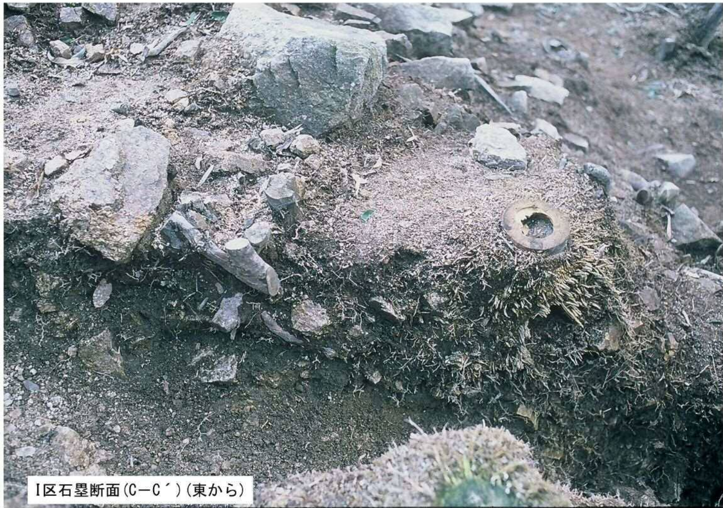
I区石罌断面(C-C') (東から)