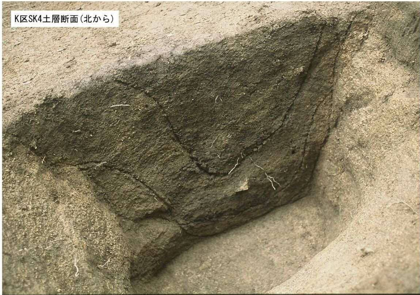
K区SK4土層断面(北から)