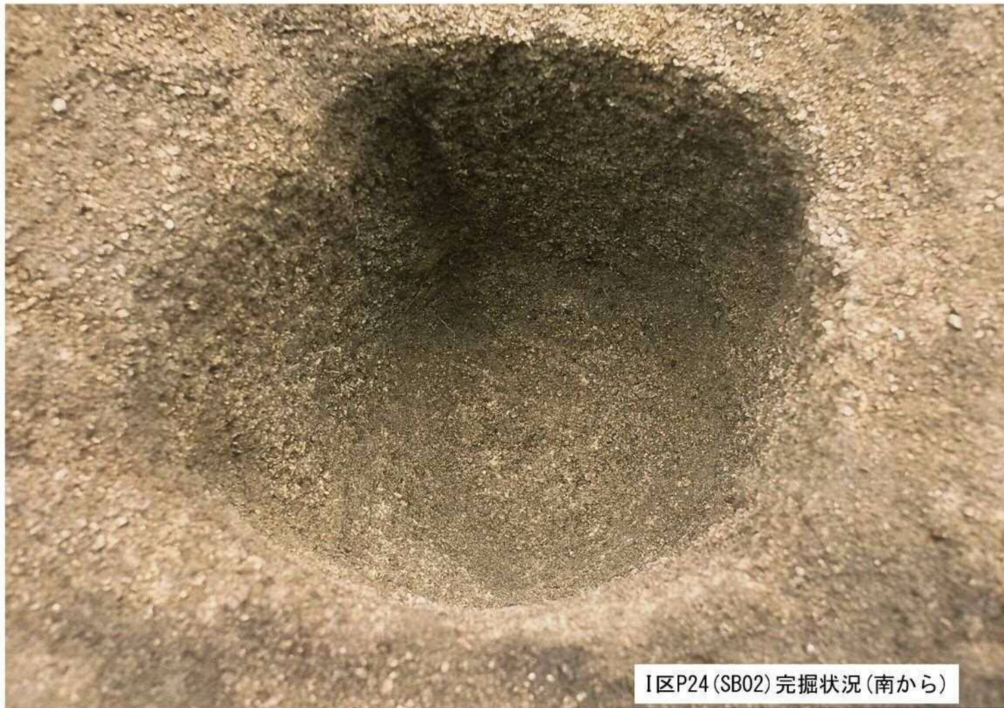
I区P24(SB02)完掘状況(南から)