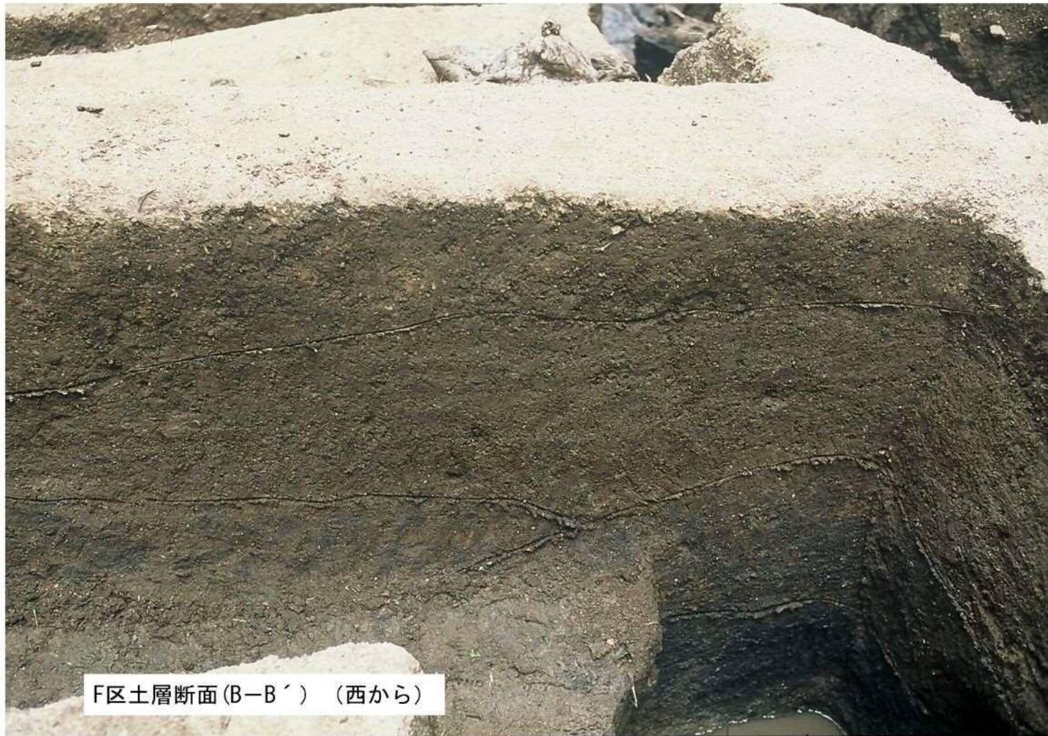
F区土層断面(B-B') (西から)