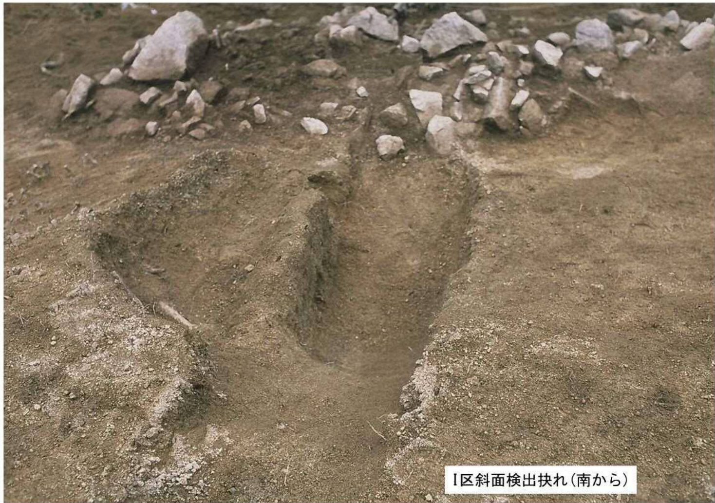
I区斜面検出抉れ(南から)