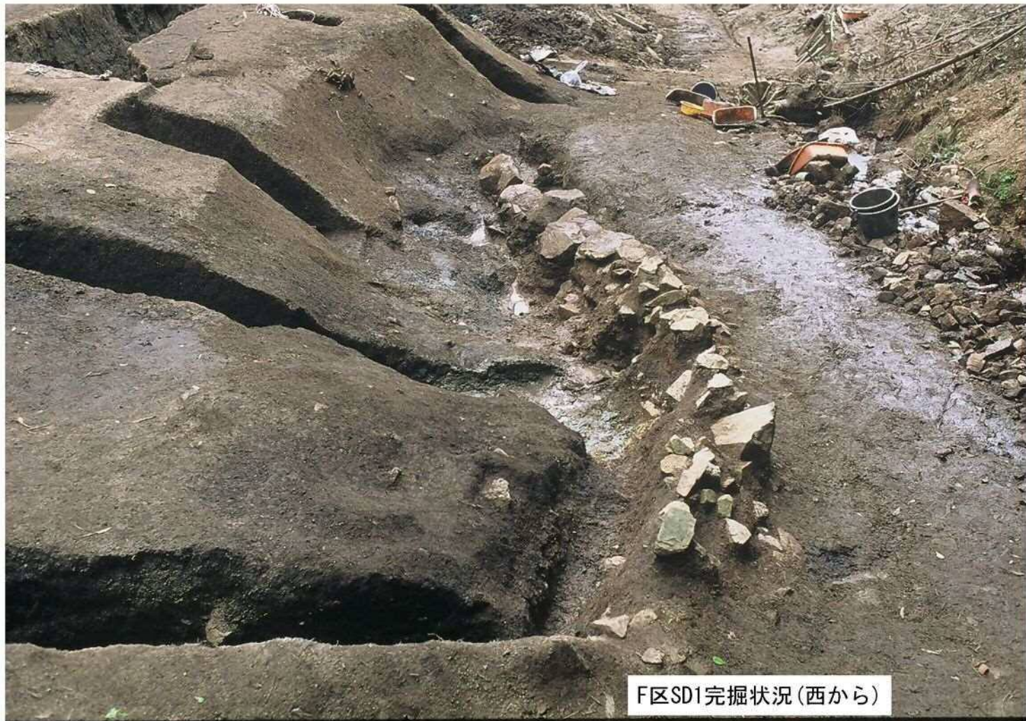
F区SD1完掘状況(西から)