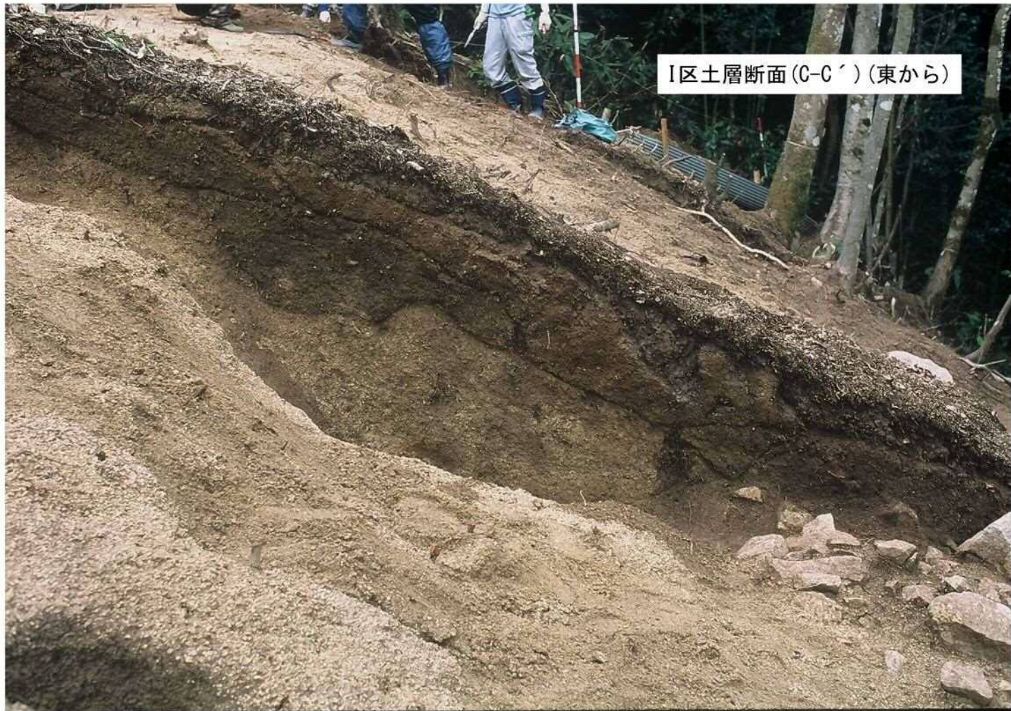
I区土層断面(C-C') (東から)