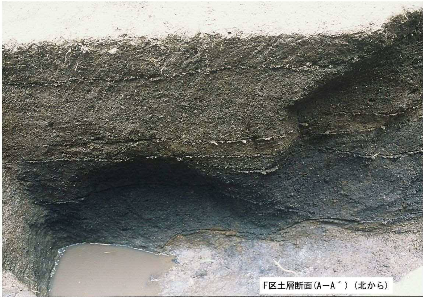
F区土層断面(A-A') (北から)