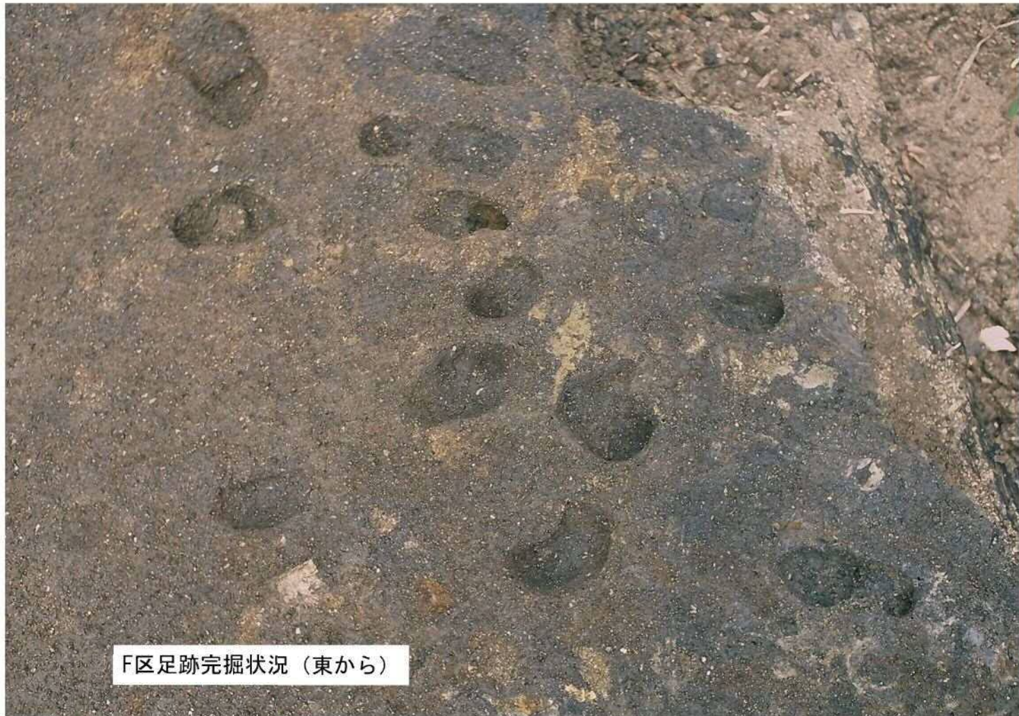
F区足跡完掘状況（東から）