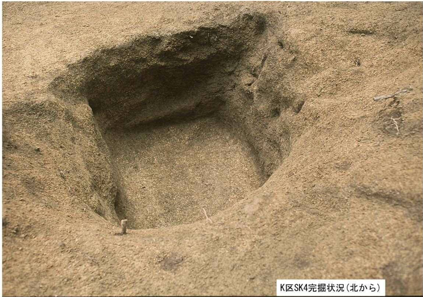
K区SK4完掘状況(北から)