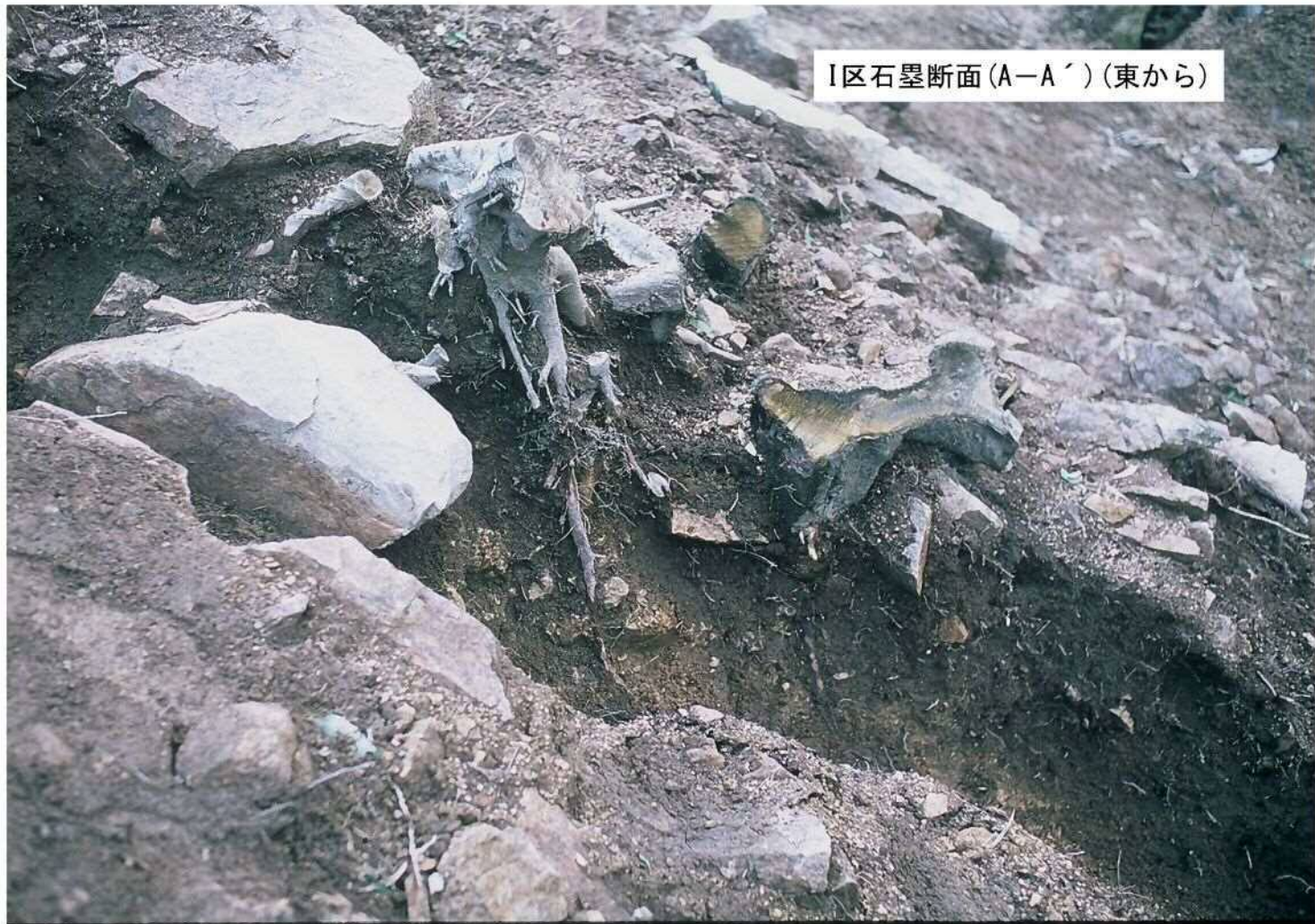
I区石塁断面(A-A') (東から)