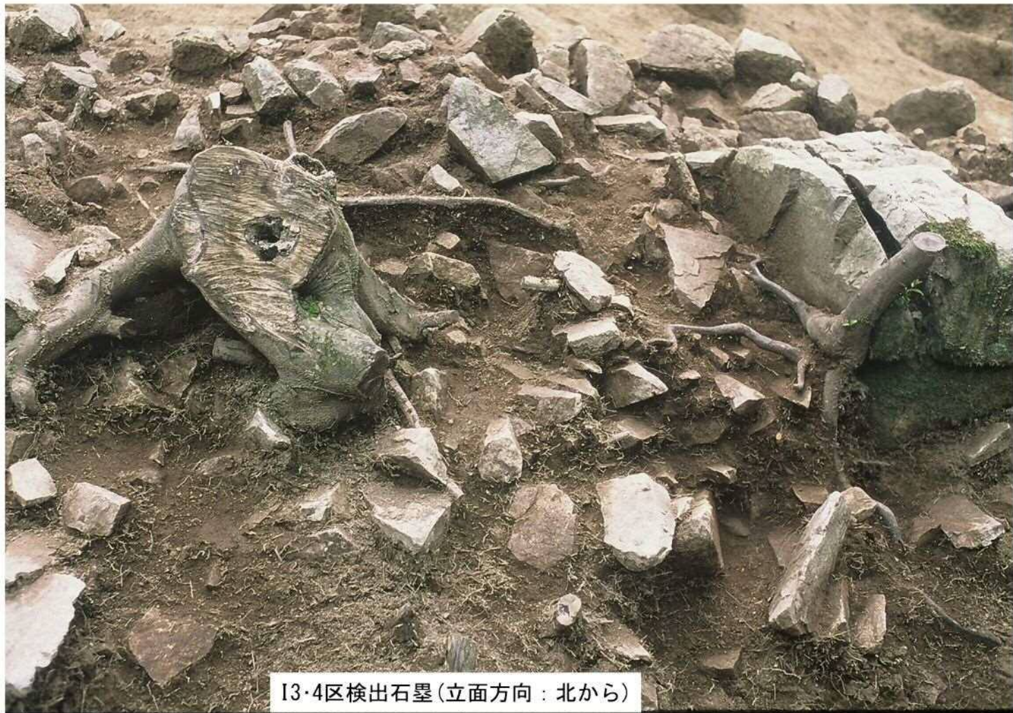
13・4区検出石罫(立面方向：北から)