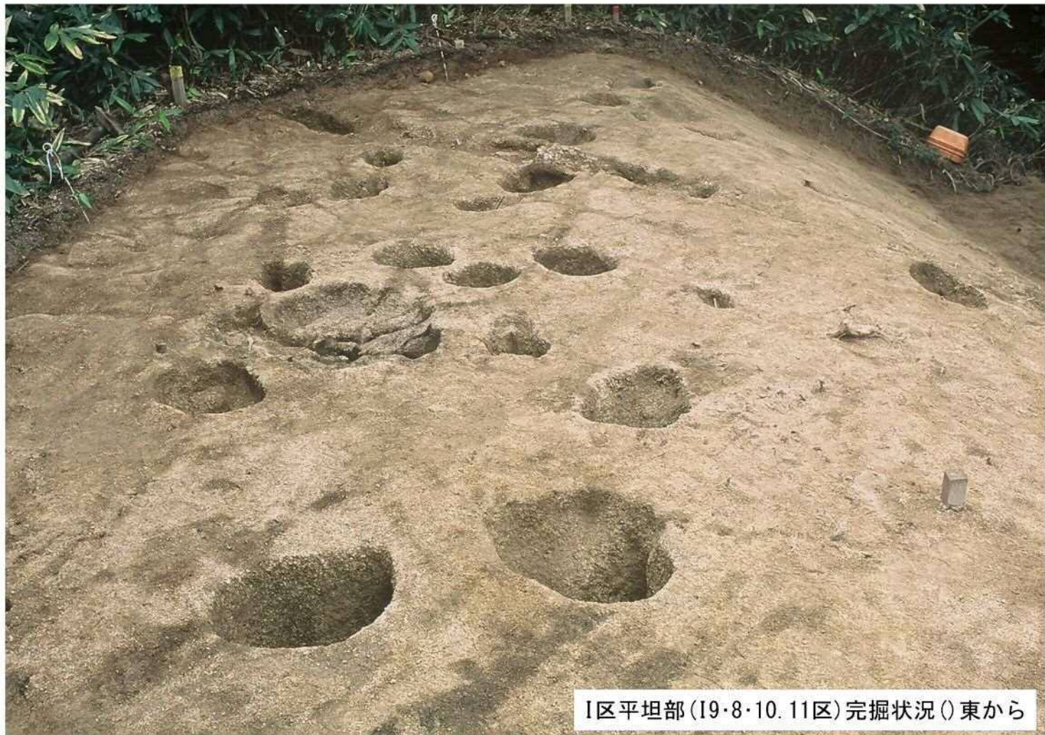
I区平坦部 (I9・8・10. 11区) 完掘状況 () 東から