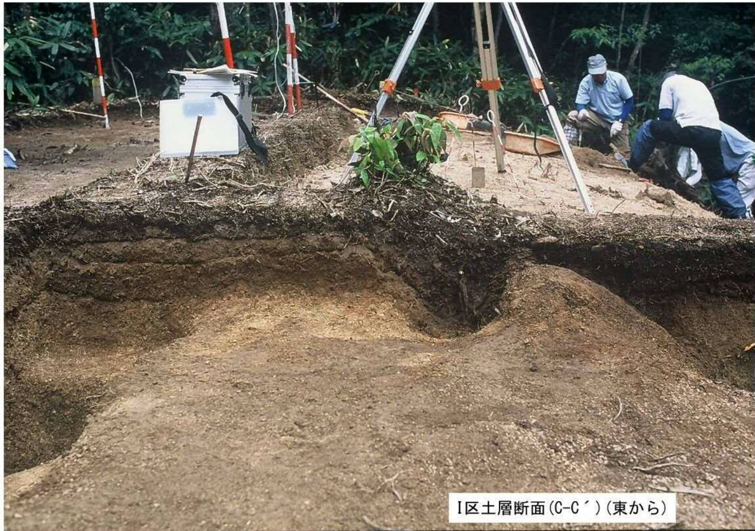
I区土層断面(C-C') (東から)