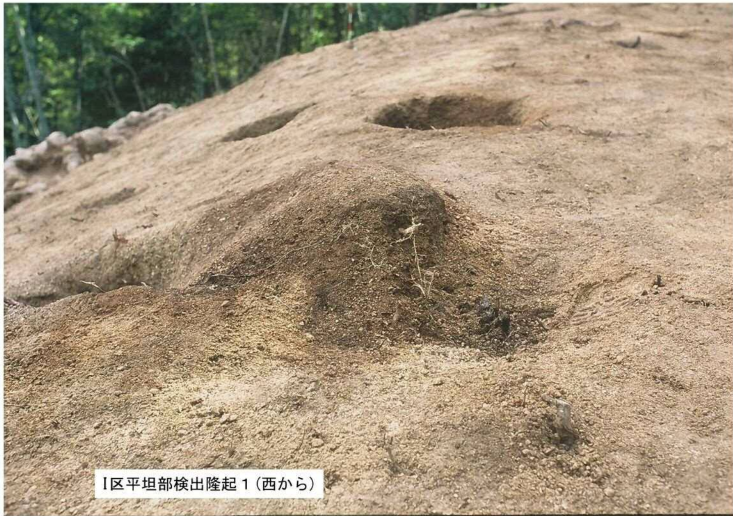
I区平坦部検出隆起1(西から)