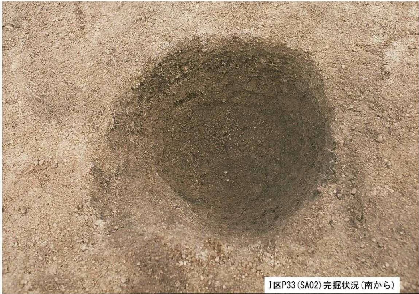
I区P33 (SA02) 完掘状況 (南から)