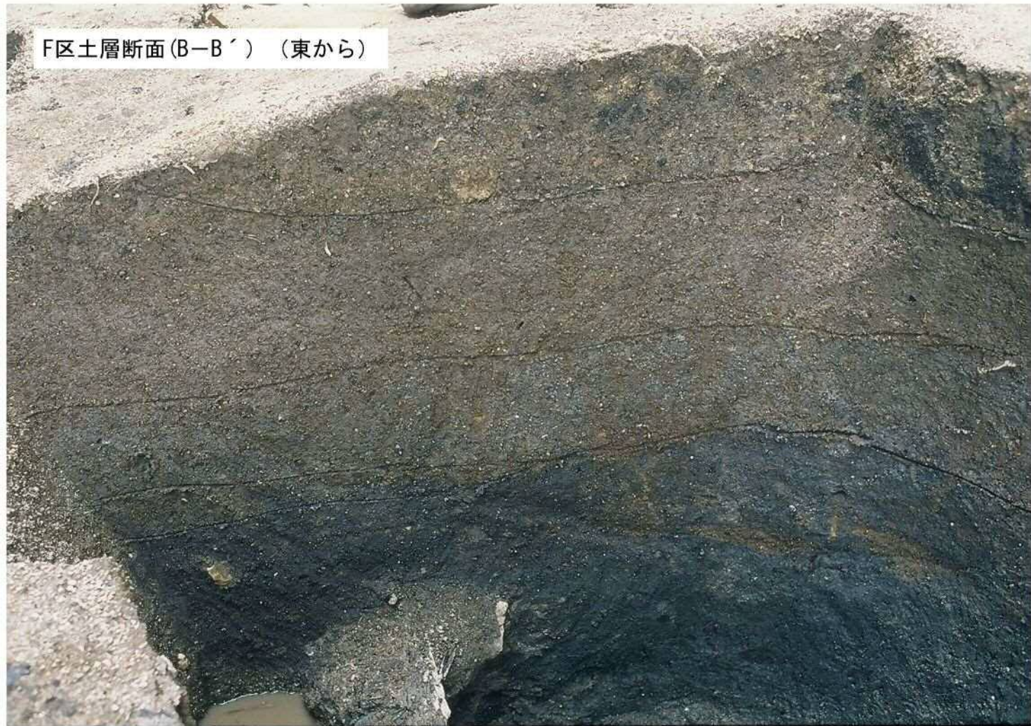
F区土層断面(B-B') (東から)