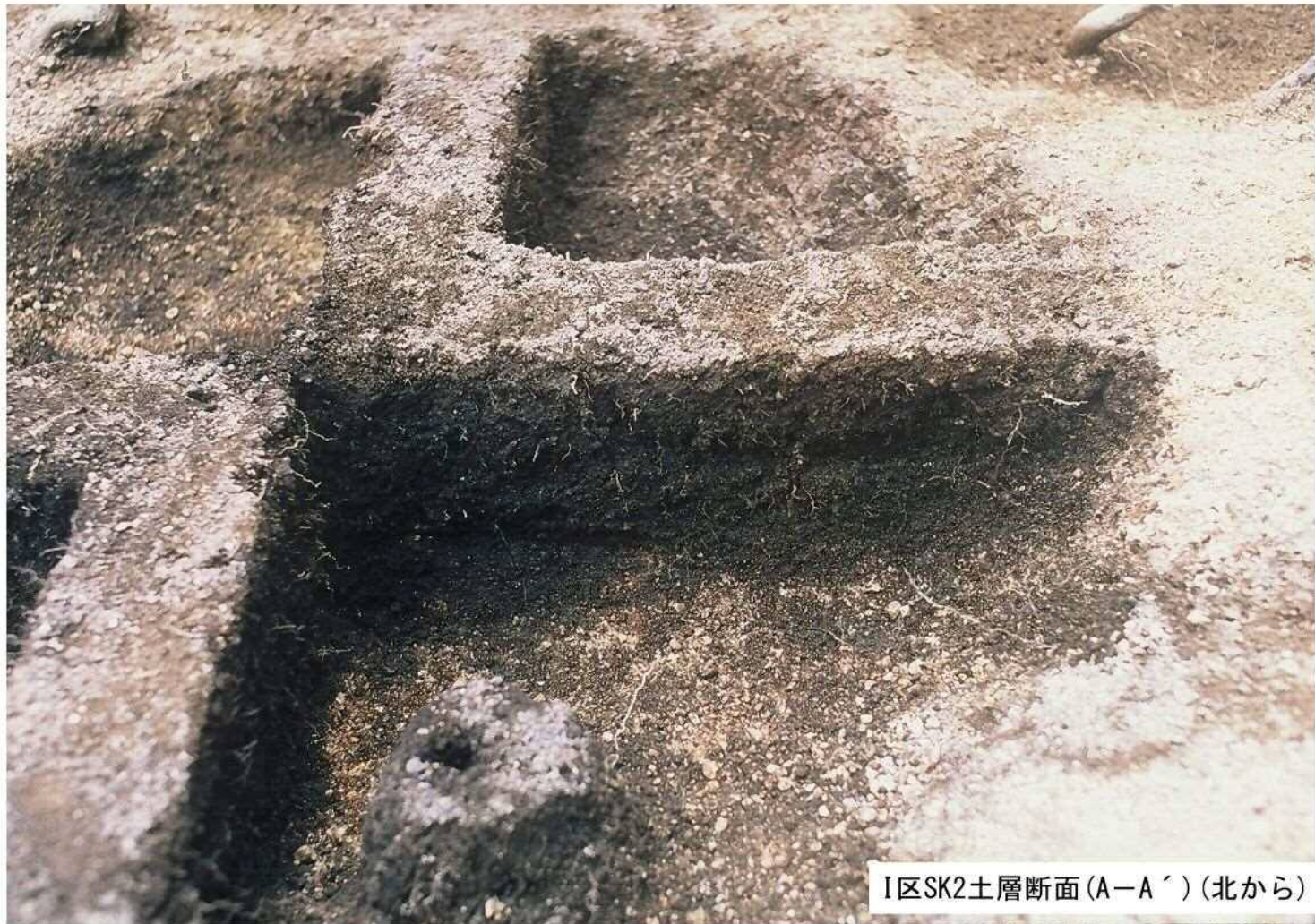
I区SK2土層断面(A-A') (北から)