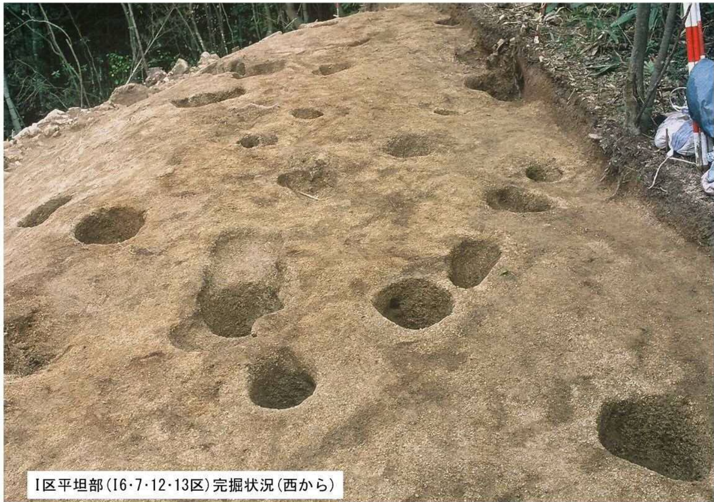
I区平坦部(I6・7・12・13区)完掘状況(西から)