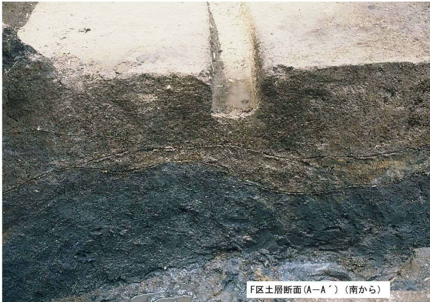
F区土層断面(A-A') (南から)