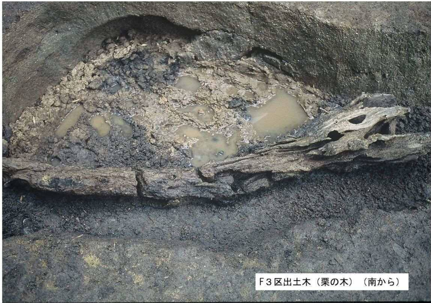
F3区出土木（栗の木）（南から）