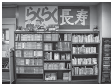
溝口・岸本図書館に大活字本コーナーがありますので、お気軽にご利用ください。

大活字本では、およそ14～22ポイントの文字が使われています。14ポイントがこの大きさ、22ポイントだとこの大きさです。