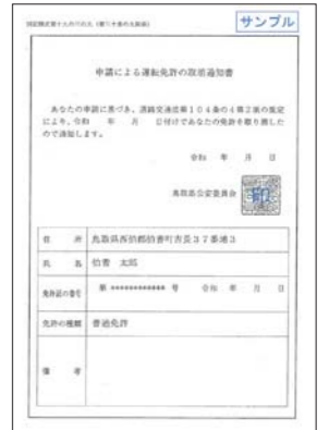
申請による運転免許の取消通知書（見本）