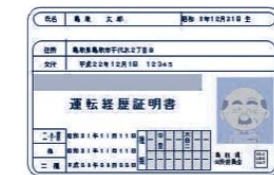
運転経歴証明書（見本）