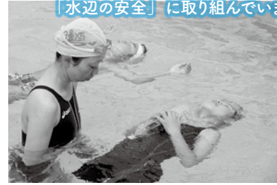
チャレンジスポーツ教室 (ペットボトル浮き体験)