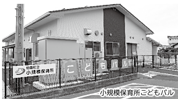
小規模保育所ことまパル