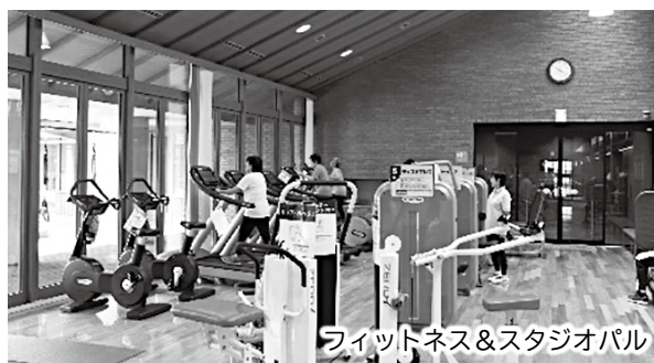
フィットネス&スタジオパル