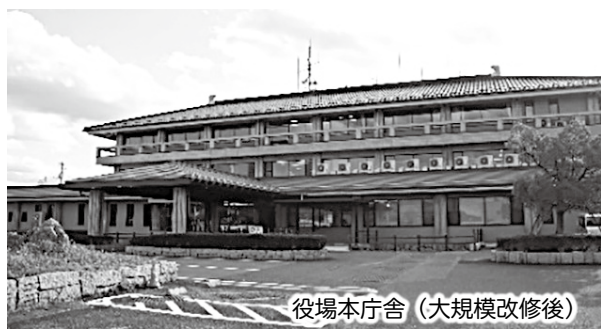
役場本庁舎（大規模改修後）