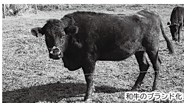
和牛のブランド化