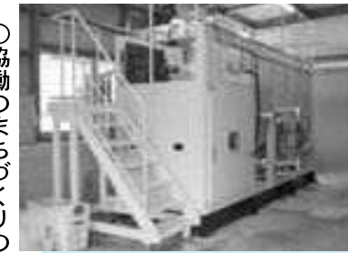
紙おむつ燃料化装置