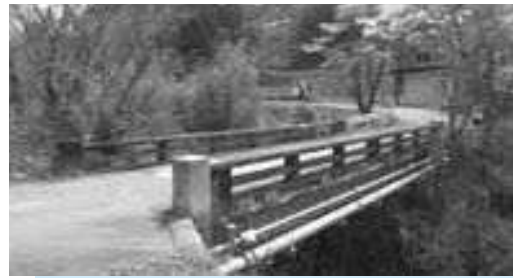
籠原栃原線(角盤橋)改良