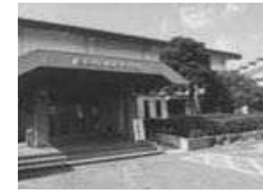
岸本体育館改修設計