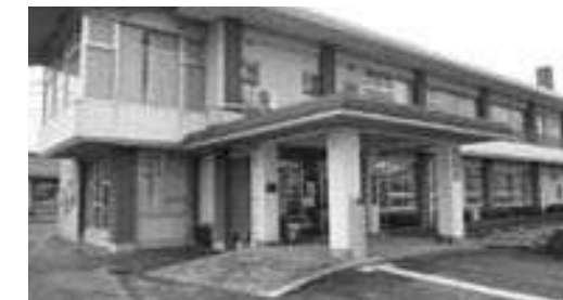
岸本老人福祉センター改修