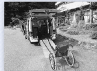
車いすの人も安心してご利用いただけます

※UDとは、ユニバーサルデザイン(Universal Design)の略で、だれもが利用しやすいように製品やサービス、環境をデザインすることです。