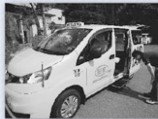
大きな荷物も運べます

「UDタクシー」は、健康な人はもちろん、足腰の弱い人や車いす使用者、ベビーカーを利用する人、妊娠中の人など誰もが利用しやすいタクシーです。黄色い車体の「UDタクシー」は、新たな公共交通として平成28年度から導入しています。