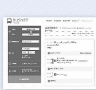
携帯やスマホで簡単に経路検索ができます

「バスネット」は鳥取大学が開発した携帯電話やスマートフォン、パソコンで手軽に利用できる路線バス・鉄道の検索システムです。経路検索や乗換情報を表示したり、パソコンケーションシステムによって路線バスの現在地を表示したりできます。県内のバス会社と連携しているのでリアルタイムでバスの時刻がわかり、非常に便利です（伯耆町デマンドバスは対応していません）。 バスネット 検索