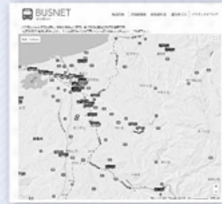
バスが今どこにいるのかがわかります