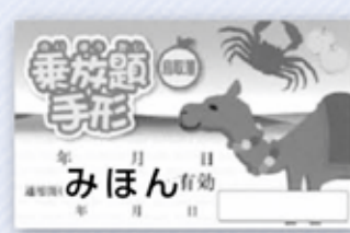
▲鳥取藩のりあいばす乗放題手形