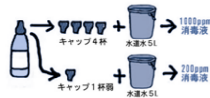
とりネット(ノロウイルスの消毒のポイント)より抜粋

(例) 市販の漂白剤(塩素濃度約5%)の場合、漂白剤のキャップ1杯は、約25CCです。