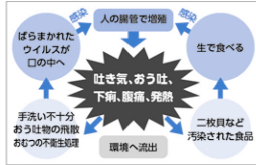
▲感染のサイクル図

平均1〜3日 ※その他 感染すると、便やおう吐物に、大量のウイルスが含まれます。下痢などの症状がなくなっても、便中にウイルスの排出が1週間程度(長いときは1か月)続くことがあります。